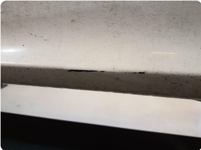
2.1 Ripe ned til grunning Tillegg skade v.bak