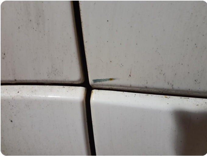
2.1 Ripe ned til grunning Tillegg skade v.bak