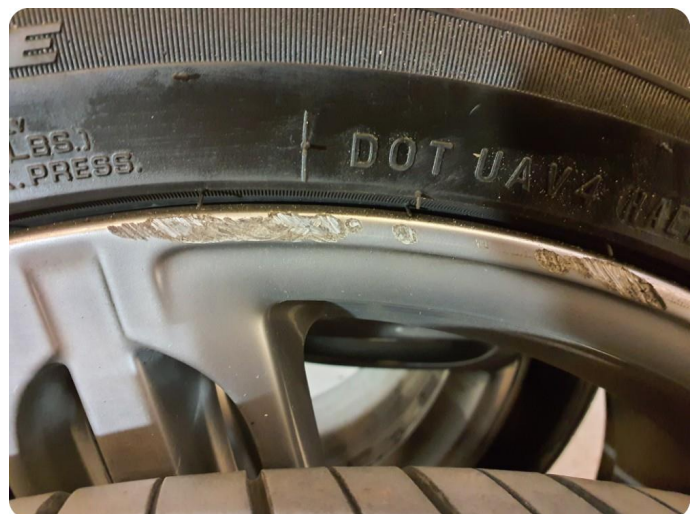
2.2 Kantkjørt felg 3 sommer 4 vinter