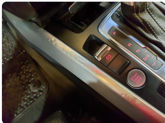
4.1 Skadet/merker etter utstyr