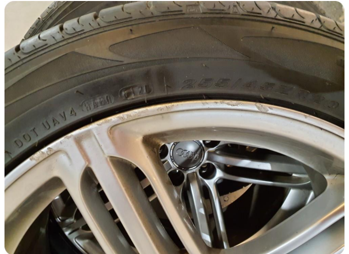
2.2 Kantkjørt felg 3 sommer 4 vinter