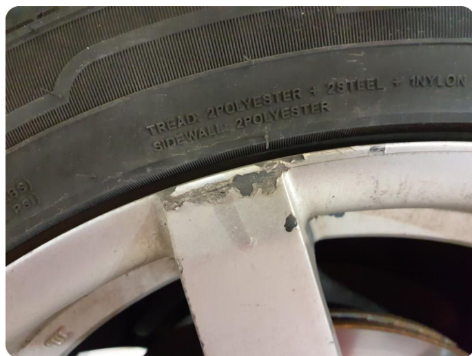
2.2 Kantkjørt felg 3 sommer 4 vinter