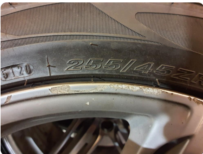
2.2 Kantkjørt felg 3 sommer 4 vinter