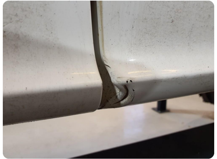
2.1 Ripe ned til grunning Tillegg skade v.bak