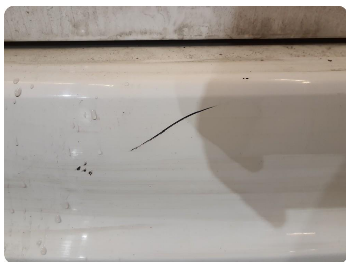
2.3 Ripe(r) ned til grunning