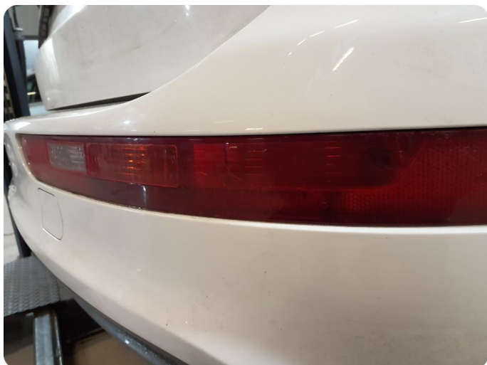
3.1 Defekt / sprukket glass Tillegg fukt , lys i fanger