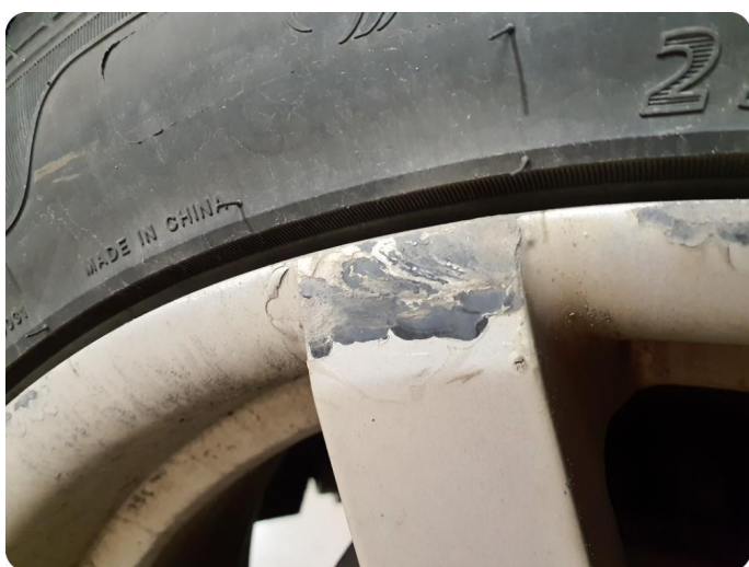
2.2 Kantkjørt felg 3 sommer 4 vinter