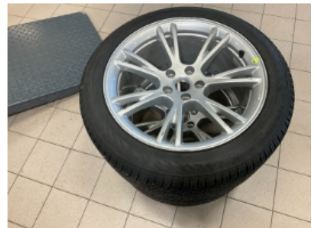
12. Ekstra hjulsett