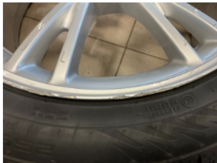
11. Ekstra hjulsett