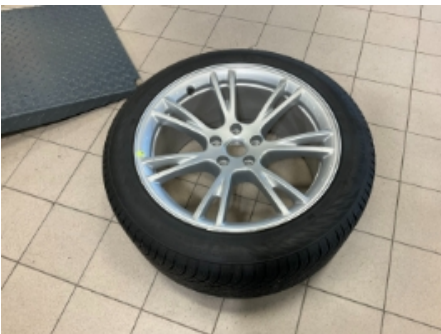
10. Ekstra hjulsett