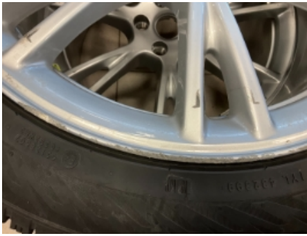
13. Ekstra hjulsett