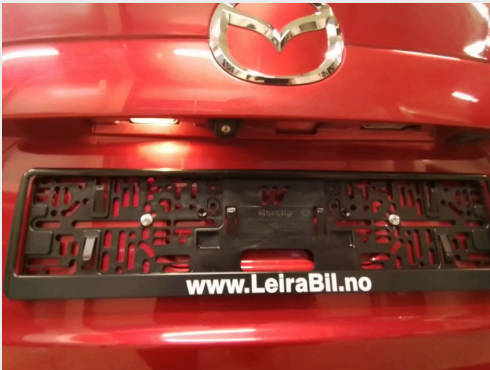
3.2 Høyre skiltlys virker ikke