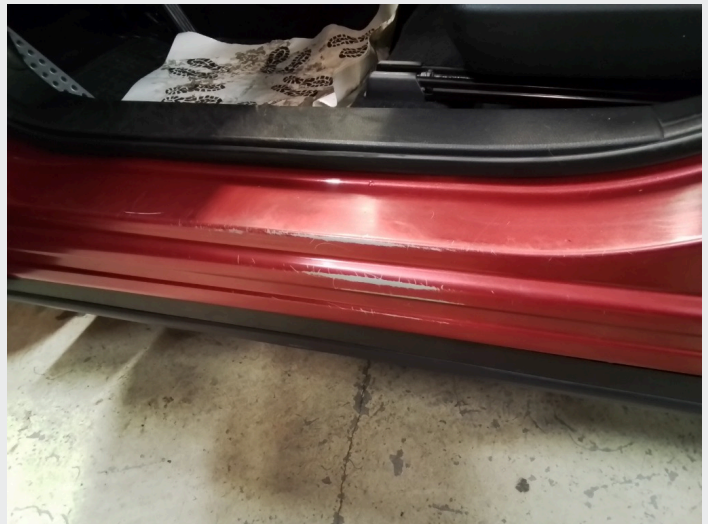
2.5 Lakkskader innsteg førerdør