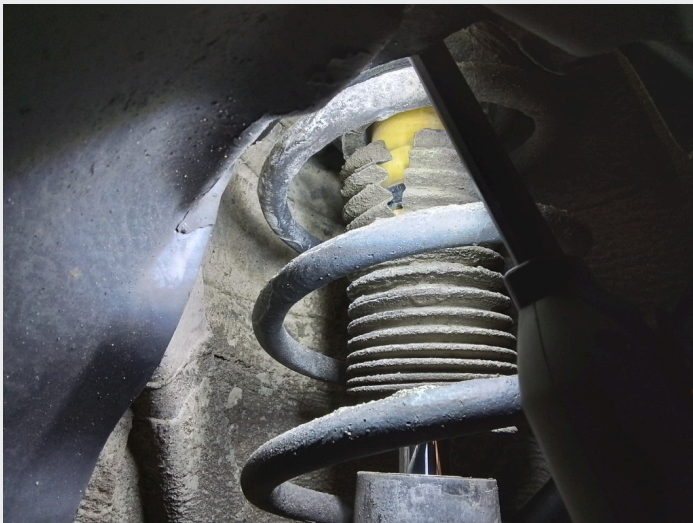
8.5 Skadede støvmansjetter til støtdempere foran