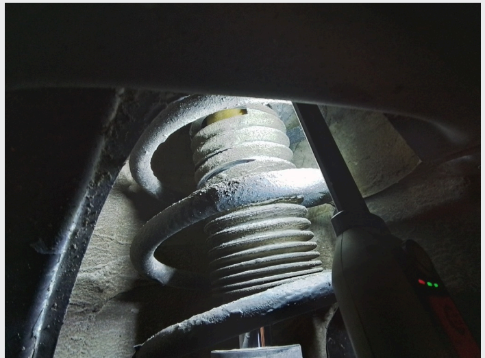
8.5 Skadede støvmansjetter til støtdempere foran