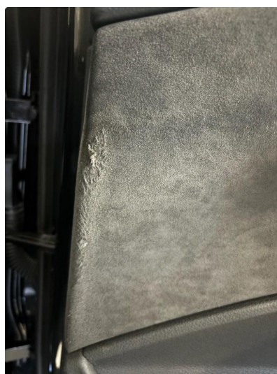
2.1 Sår i dørtrekk høyre bak.