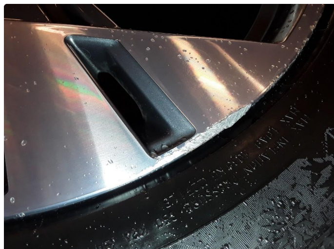
1.3 Noe kantkjørt sommerfelg.