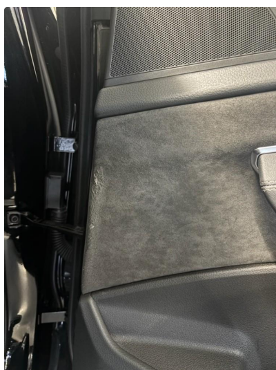
2.1 Sår i dørtrekk høyre bak.