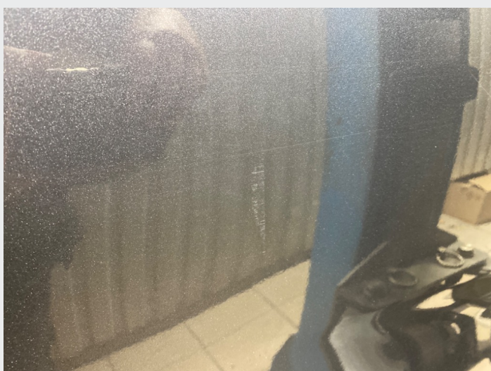
2.5 Striper høyre bakdør