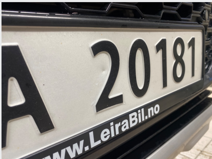
1.2 Liten bulk, skilt foran