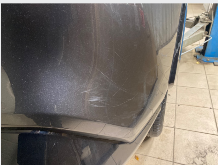
2.8 Striper høyre bak