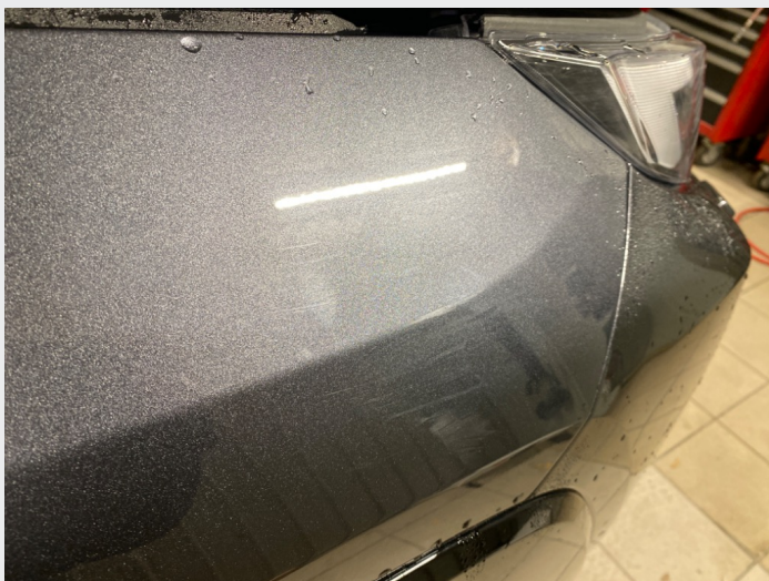
2.7 Striper høyre forskjerm