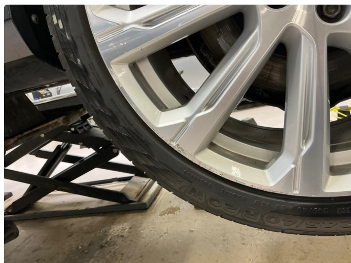
1.4 Sommerfelger 2stk. og vinterfelger 2stk.