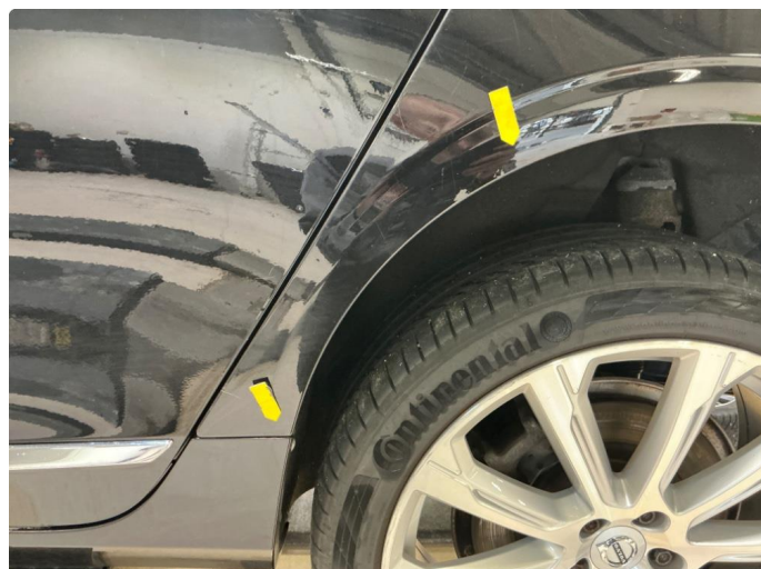
1.2 Rust, venstre baksjerm