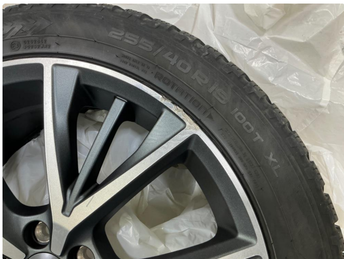
1.4 Sommerfelger 2stk. og vinterfelger 2stk.