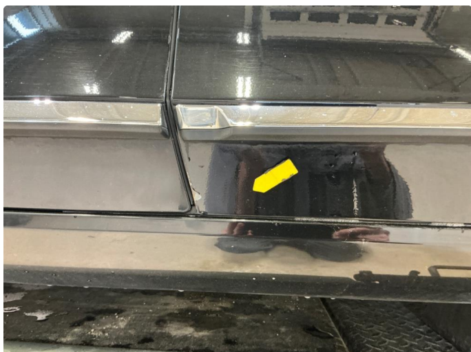
1.1 Rust/korrosjon, venstre bakdør nedre del