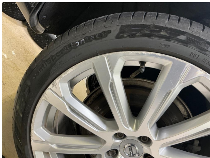
1.4 Sommerfelger 2stk. og vinterfelger 2stk.