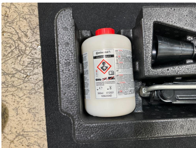
2.1 Dekktettemiddel utgått på dato