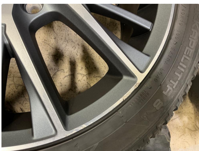
1.4 Sommerfelger 2stk. og vinterfelger 2stk.