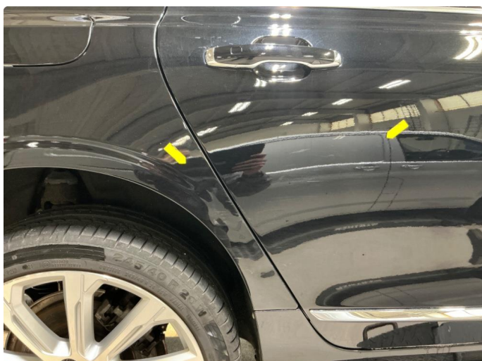
1.3 Skade, høyre baksjerm og bakdør