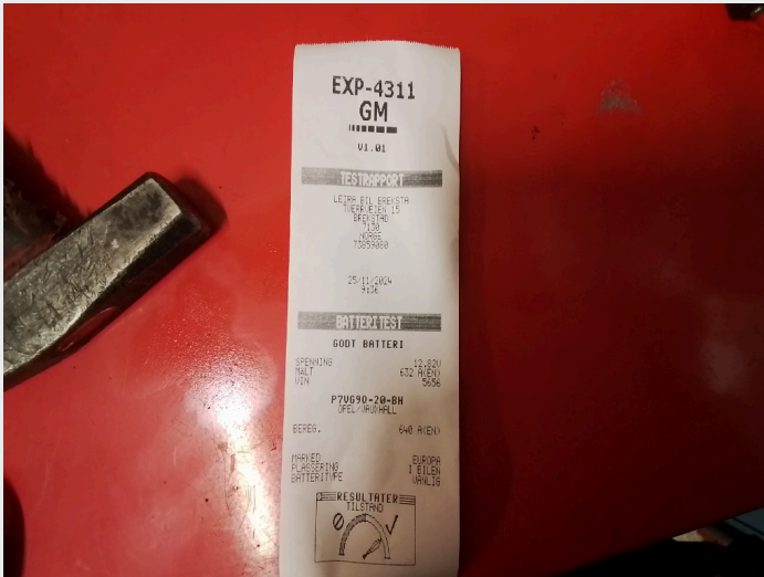
5.2 Godt batteri