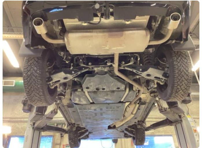
1.1 Bilen er ikke understellsbehandlet