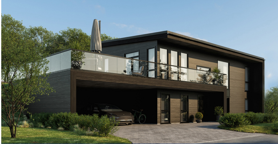
Høgdaugen 58: Mesterhus Signatur 305 - Enebolig - BRA 231 M 2