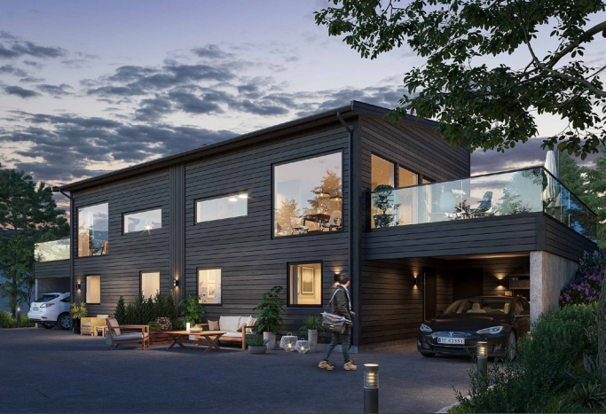
Høgdaugen 54-56: Moderne tomanns bolig - BRA 117 M 2