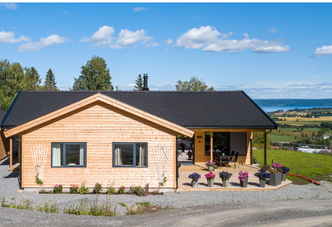
Høgdaugen 36: Østevik spesial - Enebolig - BRA 212 M 2