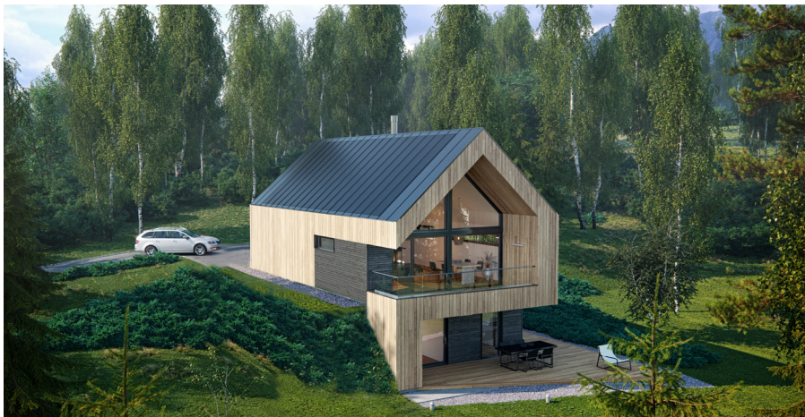
Høgdaugen 38: Mesterhus Alta - Enebolig - BRA 201 M 2

* Dette er illustrasjoner og forslag til boliger som kan passe inn på de ulike tomtene. Boligen kan tilpasses etter dine ønsker og behov. Oppgitte arealer kan avvike ved ferdig prosjektering.