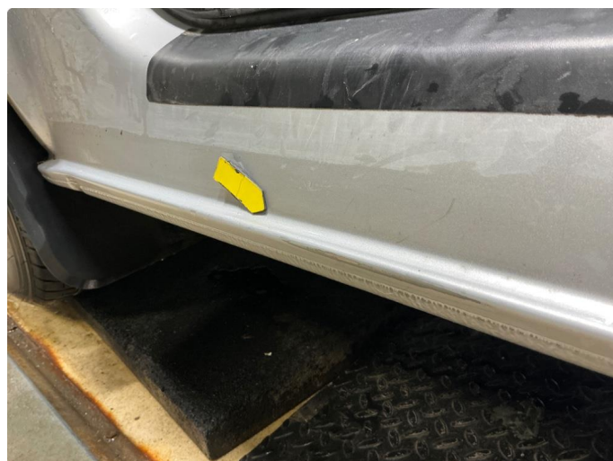
1.5 Slitt innsteg til førerdør