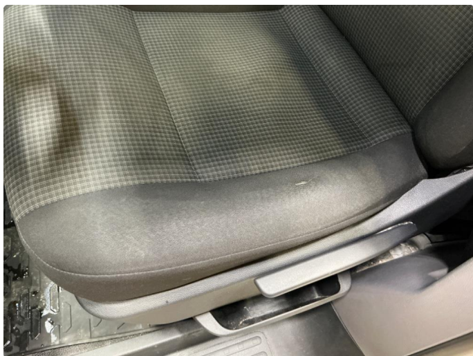
2.1 Slitt fører sete med hull