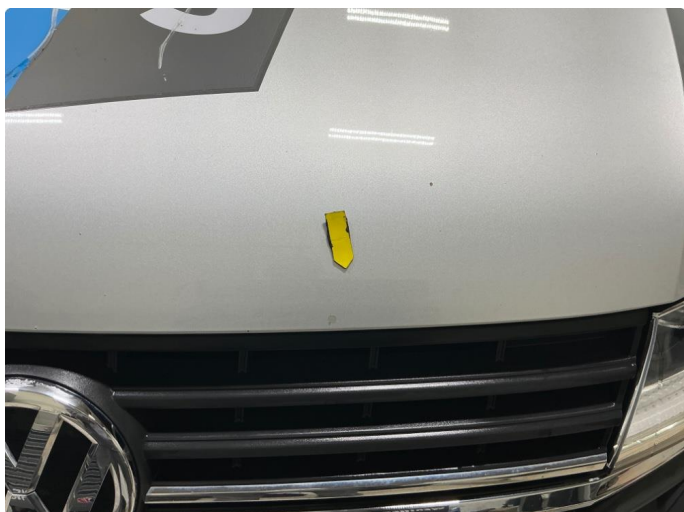
1.1 Steinsprut panser