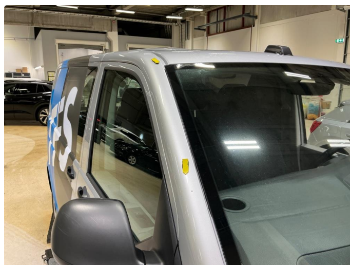
1.6 Steinsprut høyre og venstre A-stolpe utvendig