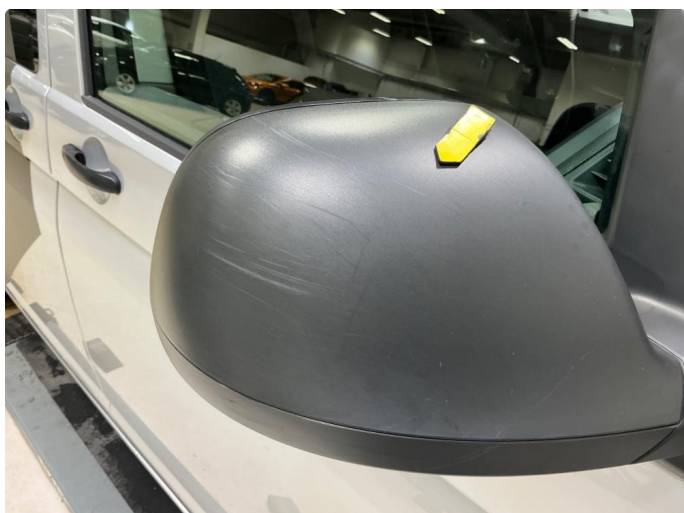
1.3 Riper høyre speilkappe