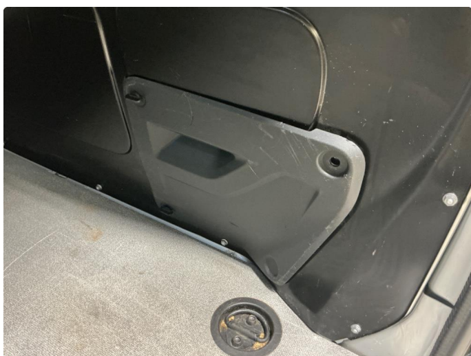
2.3 Mangler låsepinne til vareluke i varerom