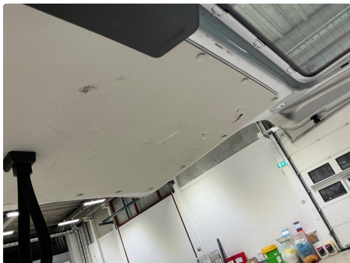
2.2 Normal slitasje varerom ihht. varebil, kjørelengde og alder. Skadet lloydsplate innvendig bakluke