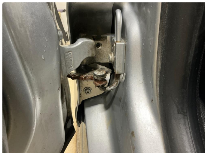
1.2 Rust dørhengsel til førerdør