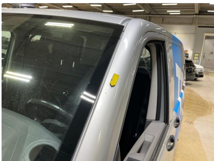
1.6 Steinsprut høyre og venstre A-stolpe utvendig