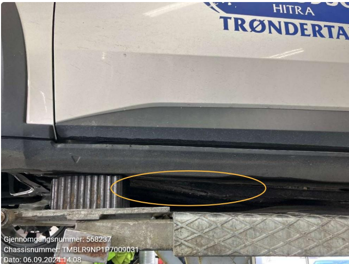
2.2 Beskyttelsesplate skadet/mangler