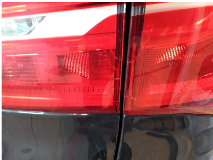
2.1 Noe krakelering i plast.