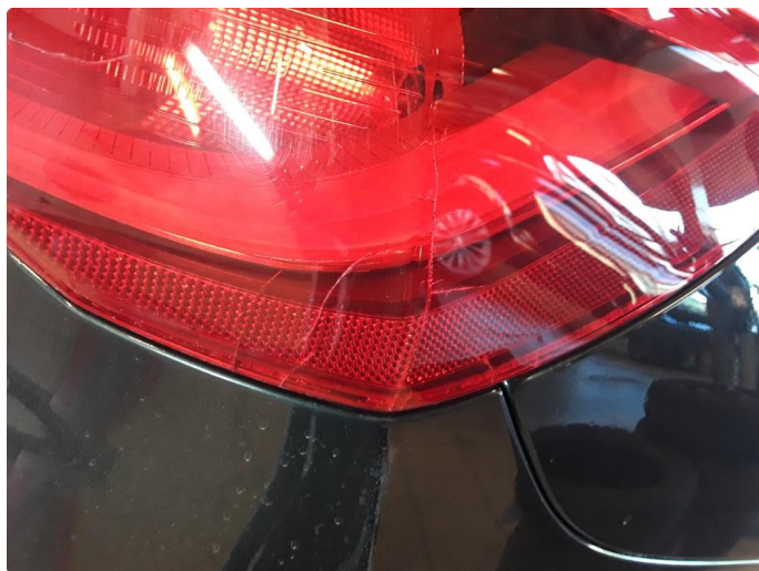
2.1 Noe krakelering i plast.