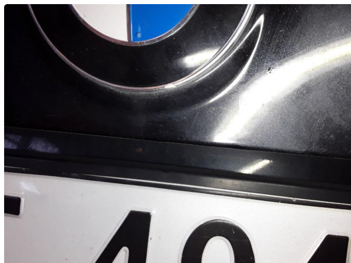
1.3 Steinsprut med korrosjon og en liten bulk.