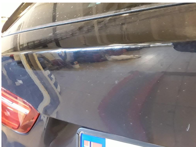
1.3 Steinsprut med korrosjon og en liten bulk.