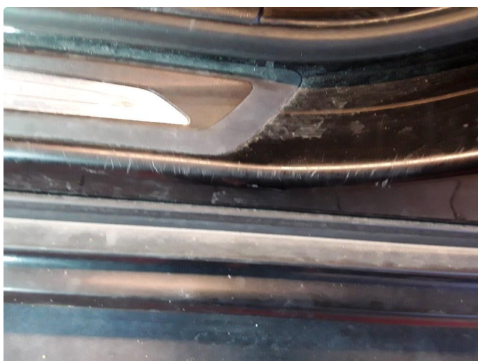
1.5 Noe riper.