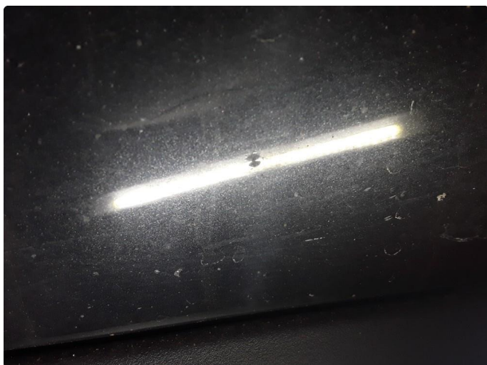
1.2 Steinsprut med korrosjon.