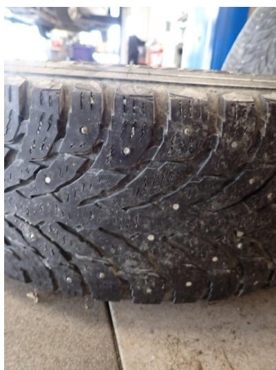
3.3 Slitte vinterdekk