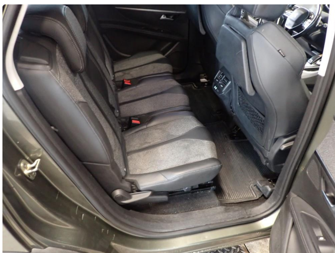
3.5 Noen riper og småbulker