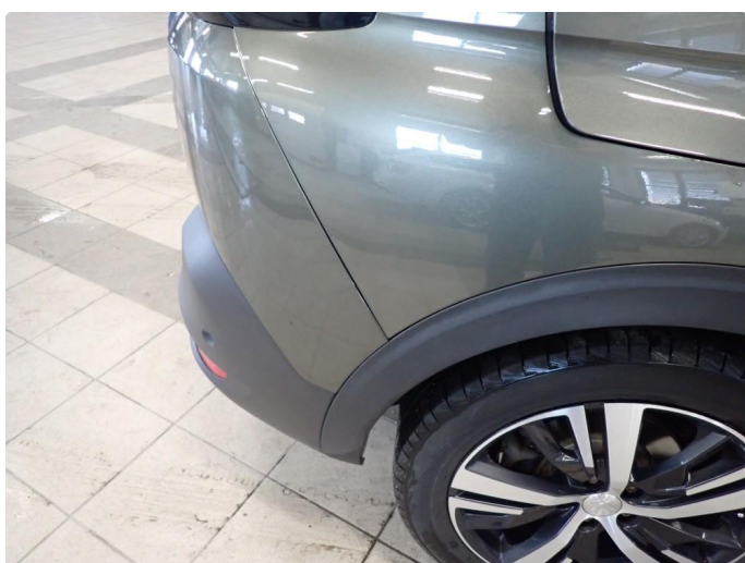
3.6 Kan se ut som har vært borti noe med bakfanger siden den ikke flukter helt med skjerm h side