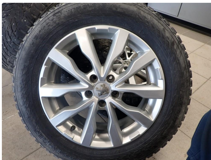
3.3 Slitte vinterdekk