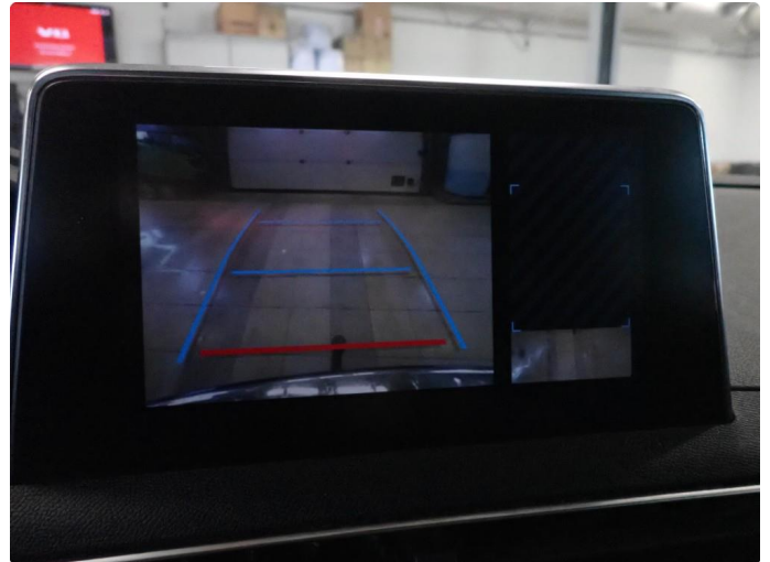
2.1 Virker ikke som alle kameraer virker. 360 kamera virker ikke som det skal. Kamera foran virker ikke. Ser ut som frontrute er skiftet.