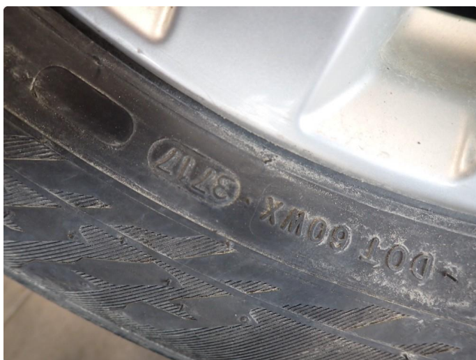
3.3 Slitte vinterdekk