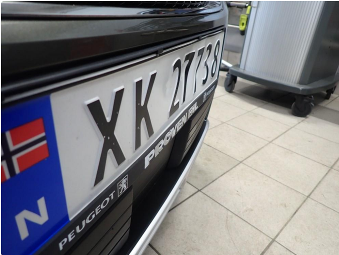
1.1 Skilt bulket