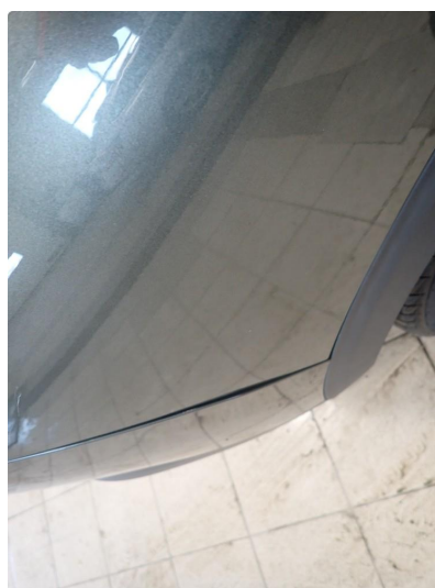
3.6 Kan se ut som har vært borti noe med bakfanger siden den ikke flukter helt med skjerm h side