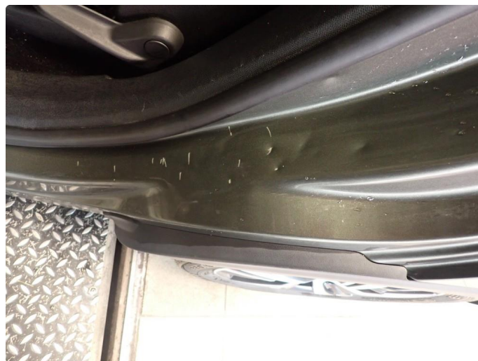
3.5 Noen riper og småbulker