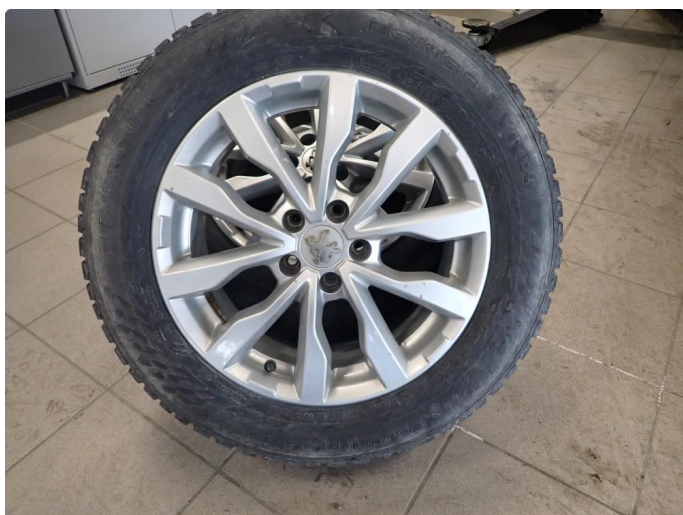
3.3 Slitte vinterdekk