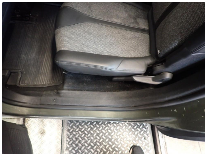
3.5 Noen riper og småbulker