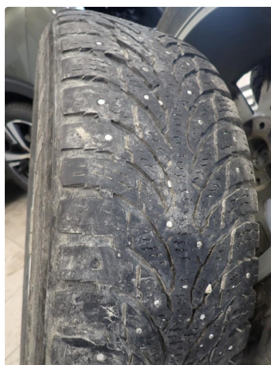
3.3 Slitte vinterdekk