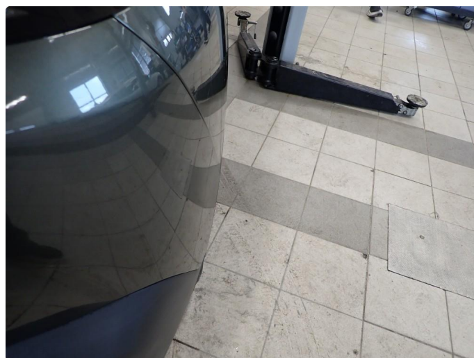
3.6 Kan se ut som har vært borti noe med bakfanger siden den ikke flukter helt med skjerm h side