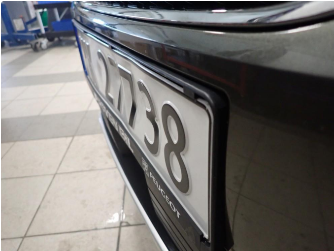
1.1 Skilt bulket