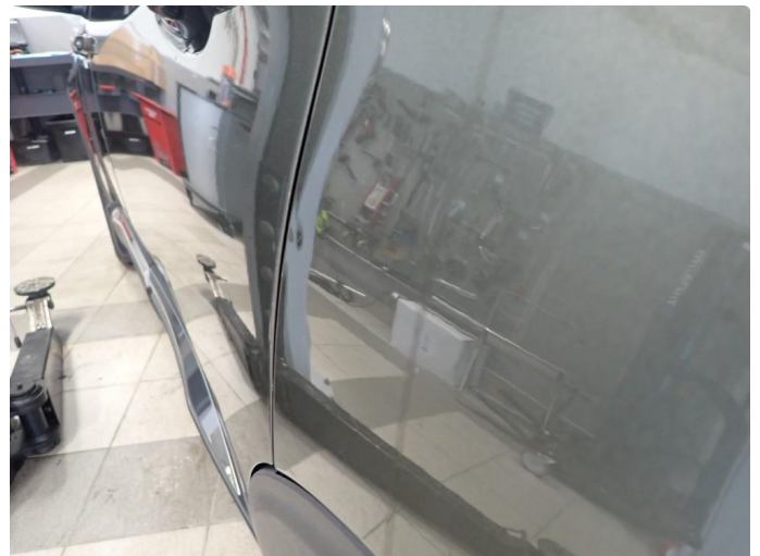
3.1 Bakdør h side liten bulk + baksjerm v side