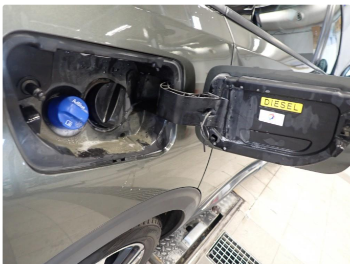
3.8 Går vondt opp. Muligens svingmekanismen