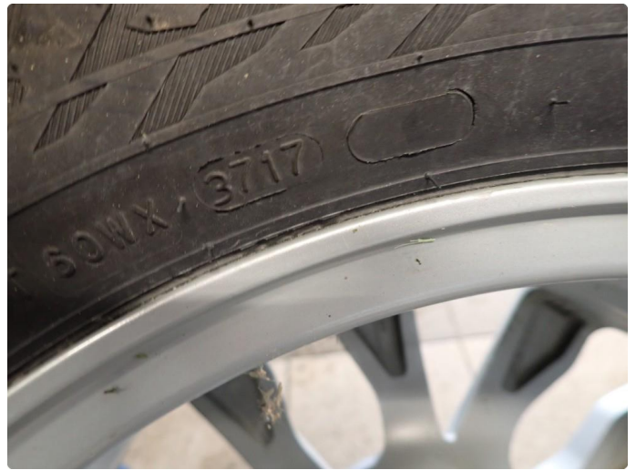
3.3 Slitte vinterdekk