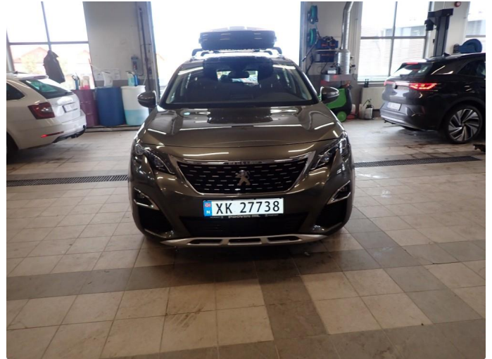
1.1 Skilt bulket