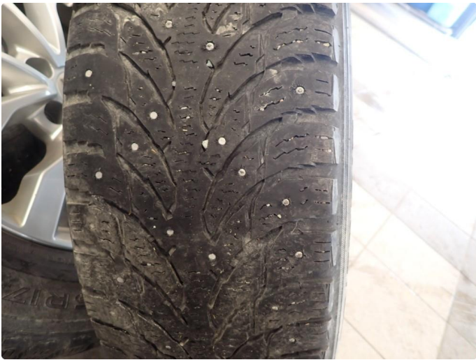
3.3 Slitte vinterdekk