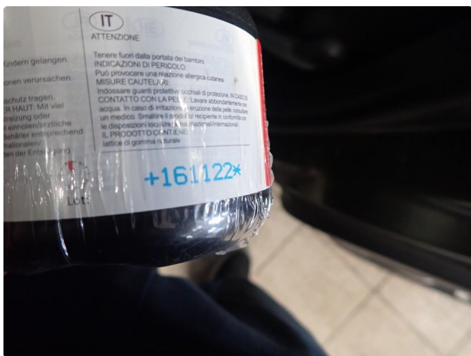
3.2 Dekktemid. utgått på dato