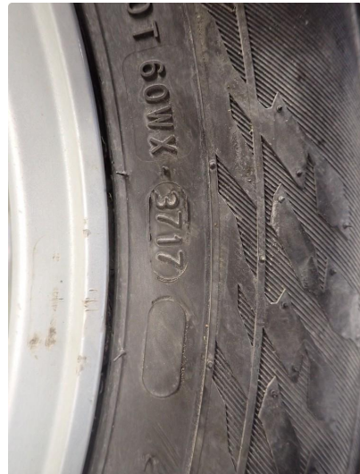
3.3 Slitte vinterdekk