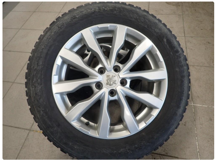
3.3 Slitte vinterdekk