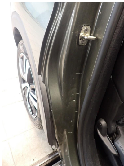
3.5 Noen riper og småbulker