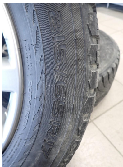
3.3 Slitte vinterdekk