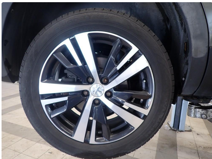
3.4 Felg er litt kantkjørt