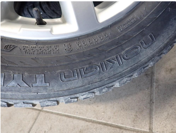
3.3 Slitte vinterdekk