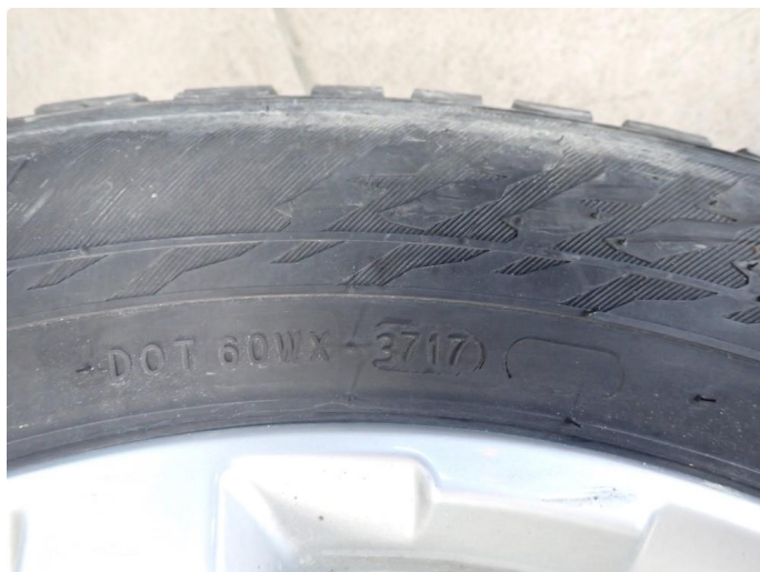
3.3 Slitte vinterdekk