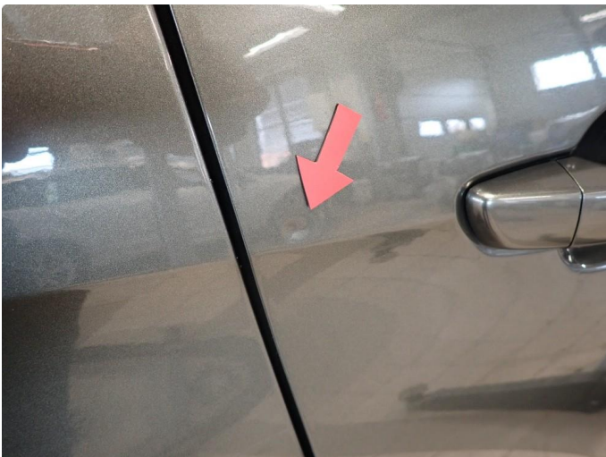
3.1 Bakdør h side liten bulk + baksjerm v side