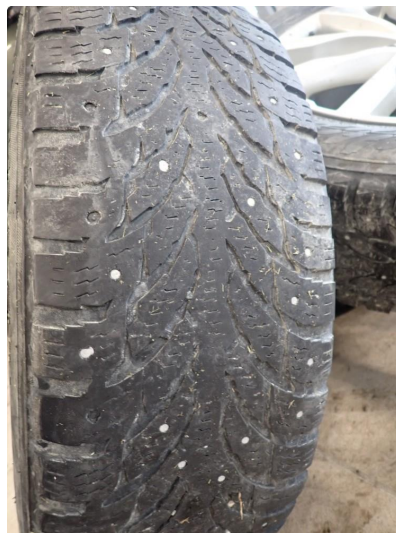
3.3 Slitte vinterdekk