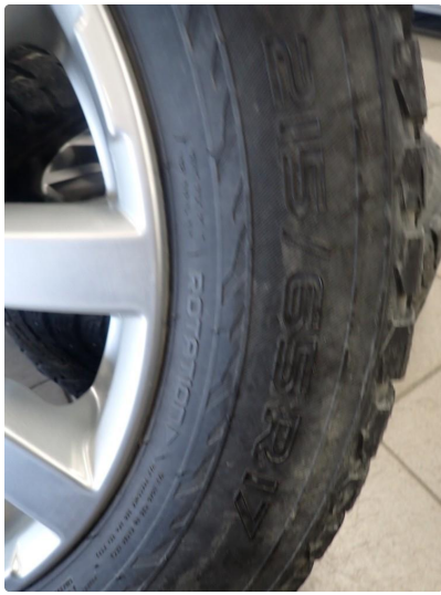
3.3 Slitte vinterdekk