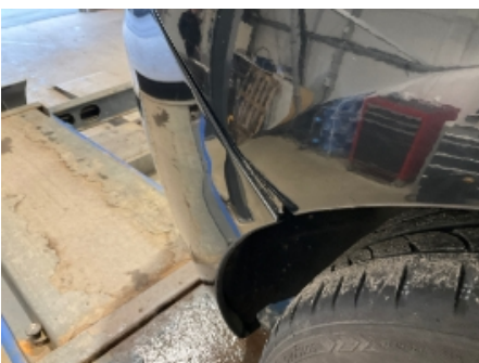
10. Lakk / karosseri utvendig