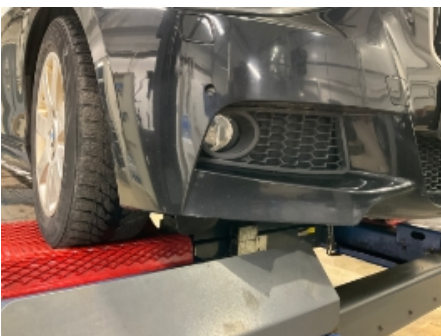
7. Lakk / karosseri utvendig