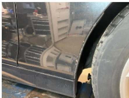
8. Lakk / karosseri utvendig