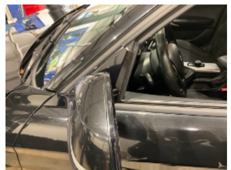
6. Utvendig speil