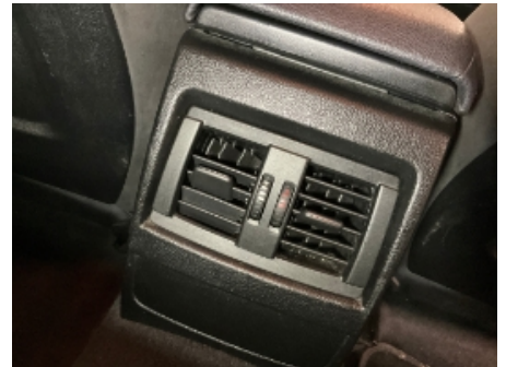
3. Luftdyse kupé