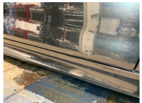
9. Lakk / karosseri utvendig