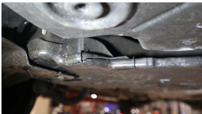
1.1 Beskyttelsesplate skadet/mangler