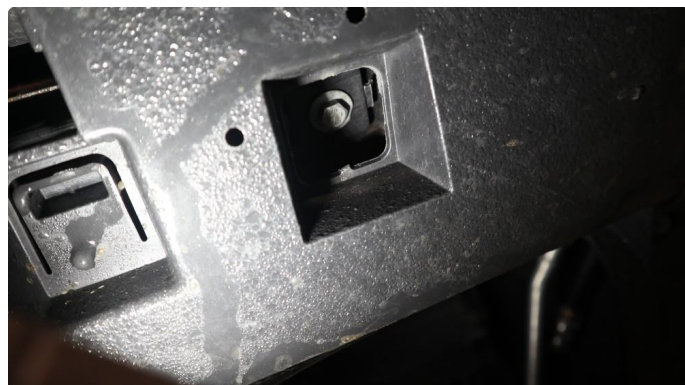
1.1 Beskyttelsesplate skadet/mangler