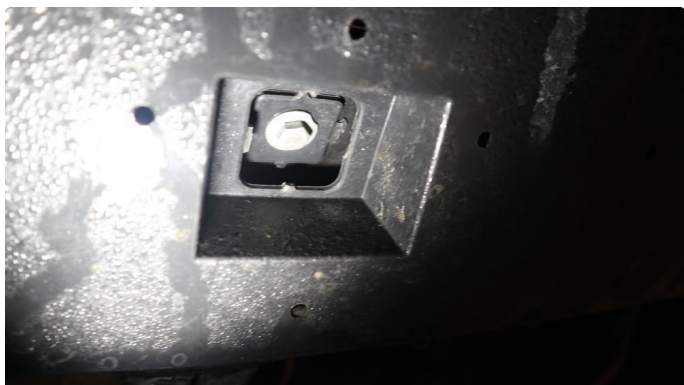
1.1 Beskyttelsesplate skadet/mangler