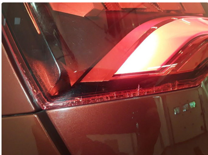
2.1 Krakelering på baklampe. Byttes før levering. Time bestilt.