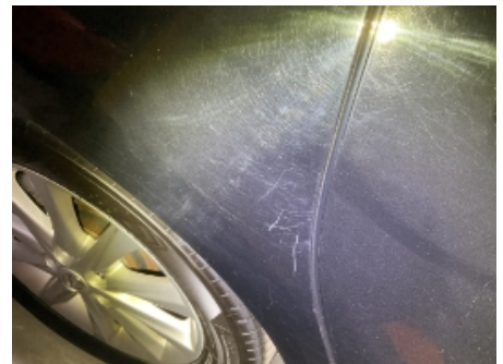
12. Høyre bakskjerm