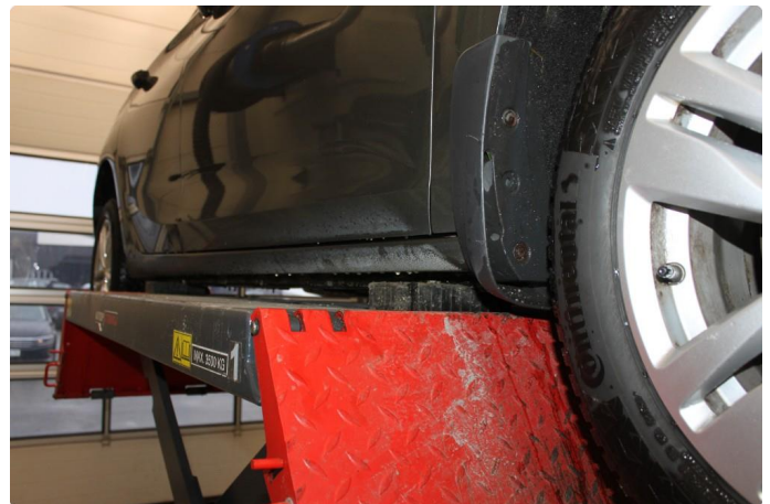
1.6 En del lakkslitasje på kanal høyre side. På venstre side er det opplakkert. Ser ok ut her.