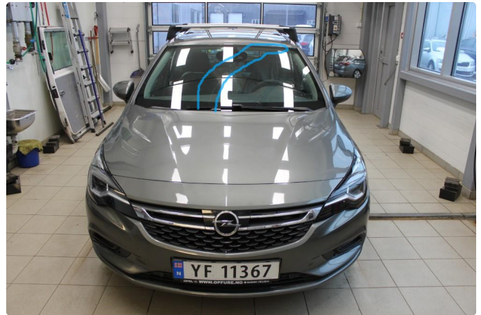
1.5 Lang ripe i frontrute, følger ytre kant på venstre viskerblad.