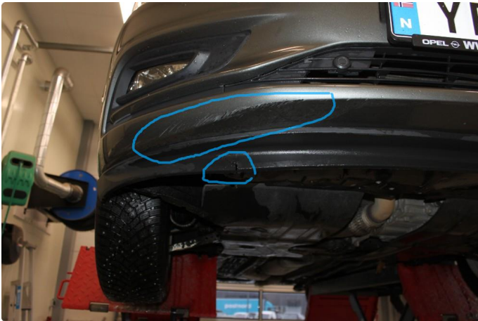
1.4 Spoilerlist har revnet noe og det er skrapemerker på nedre del av frontleppe