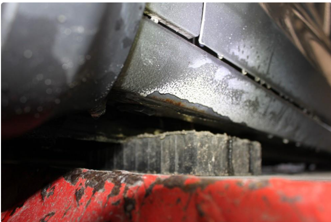
1.6 En del lakkslitasje på kanal høyre side. På venstre side er det opplakkert. Ser ok ut her.