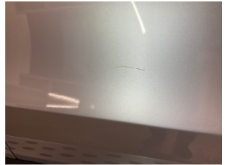
3. Lakk / karosseri utvendig