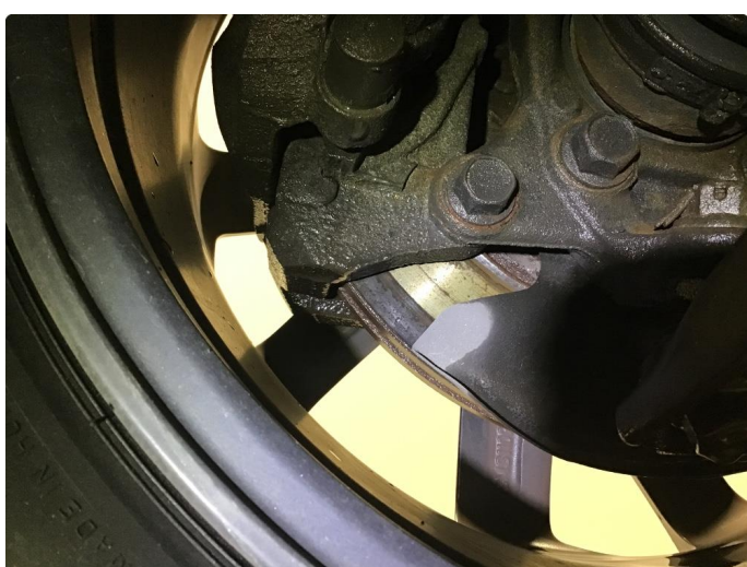
2.1 Mer enn 25% rust