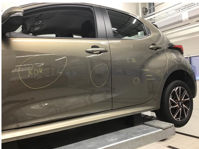
1.1 Ufagmessig utført arbeid