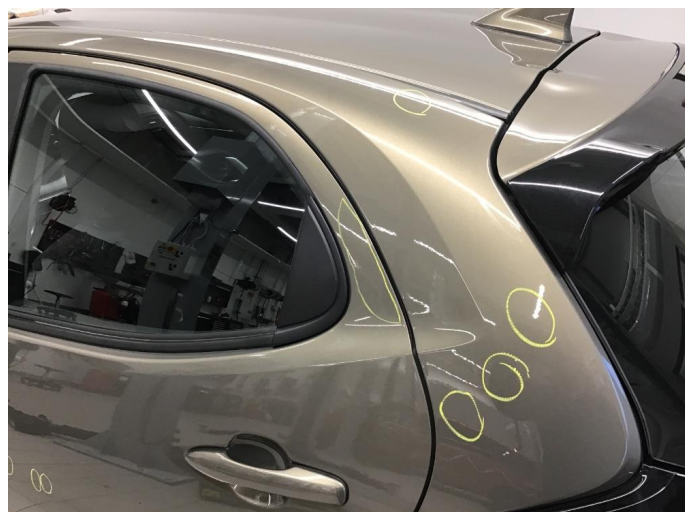
1.1 Ufagmessig utført arbeid