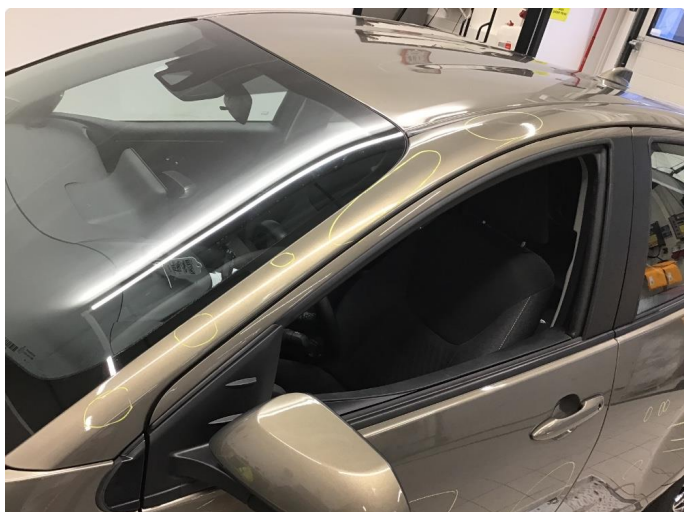
1.1 Ufagmessig utført arbeid