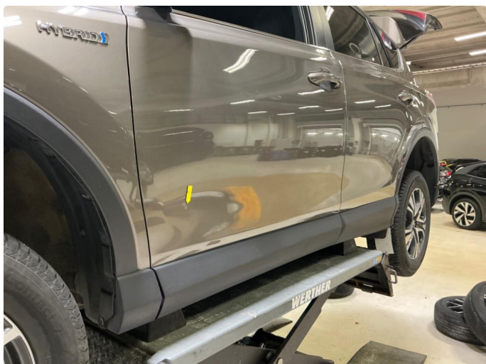
1.2 Liten bulk v.f.d.