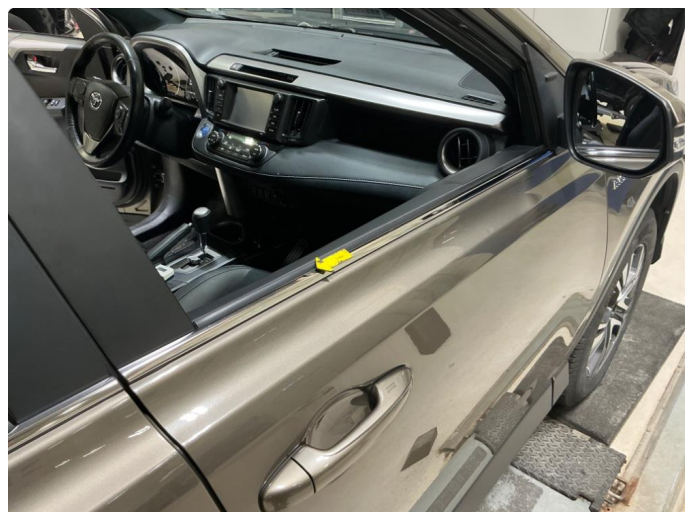
1.3 Liten bulk på kromlist h.fordør.