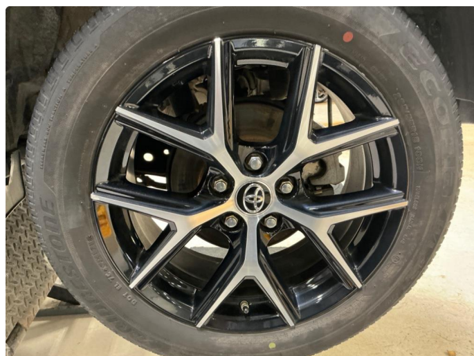
1.6 Kosmetisk skade på sommerfelger