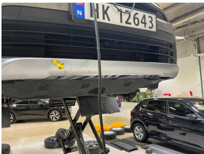
1.8 Riper nedre del fanger foran