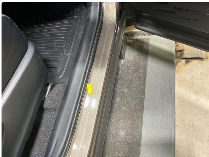
1.7 Slitte innsteg. Blærer + riper