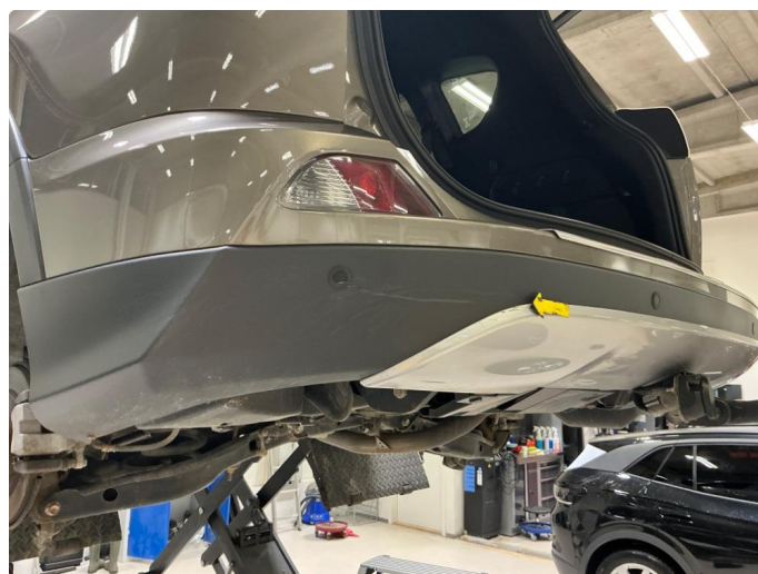
1.9 Riper nedre del fanger bak