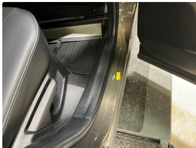
1.7 Slitte innsteg. Blærer + riper