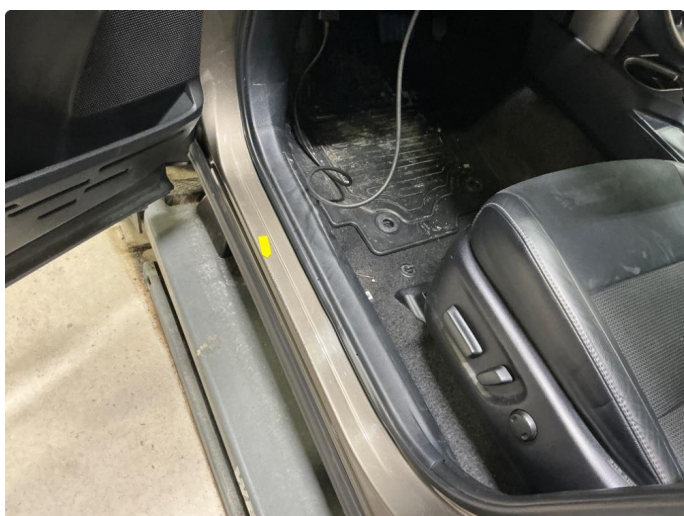
1.7 Slitte innsteg. Blærer + riper