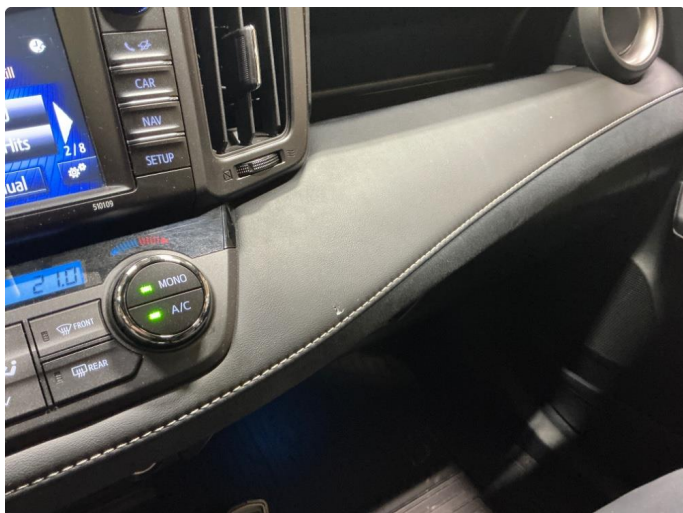
3.1 Lite sår på dashbord.