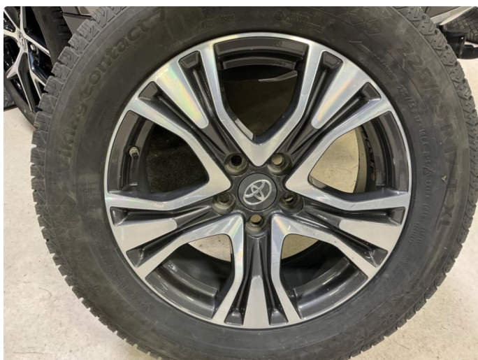
1.5 Kosmetisk skade på vinterfelger.