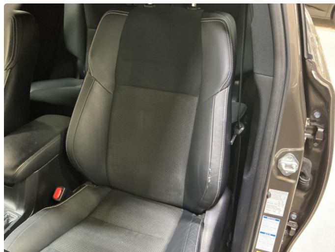
3.2 Lite sår på seterygg førerstol