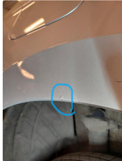
1.2 Liten steinsprut med rust, blir utbedret før levering