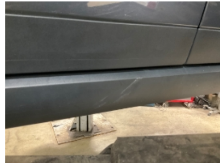
3. Lakk / karosseri utvendig