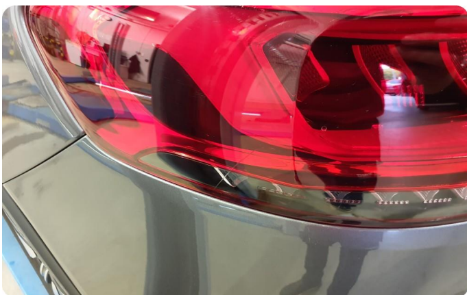
3.1 Defekt / sprukket glass