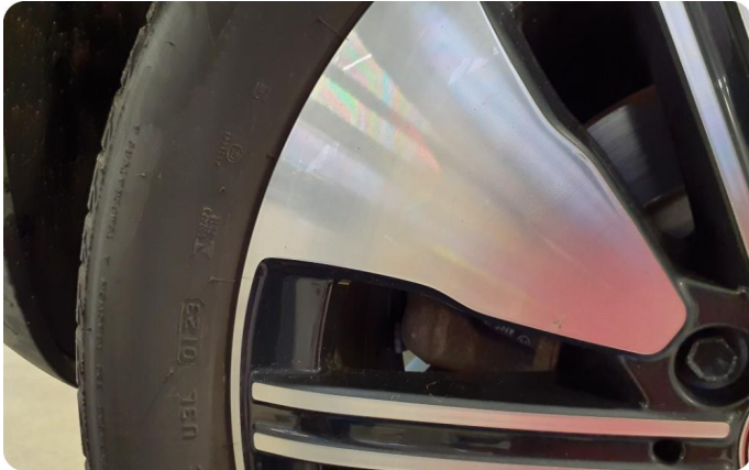
2.1 Kantkjørt felg Diamond Cut To stk sommer felg