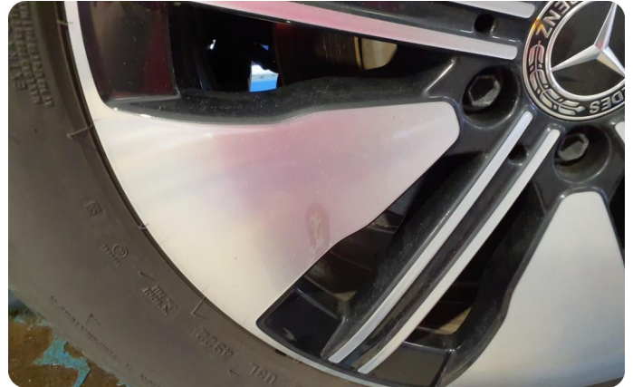
2.1 Kantkjørt felg Diamond Cut To stk sommer felg