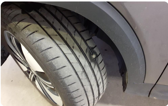
2.2 Punktert dekk