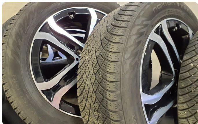
2.3 Kantkjørt felg Diamond Cut To stk vinter felger og to stk sommer felger