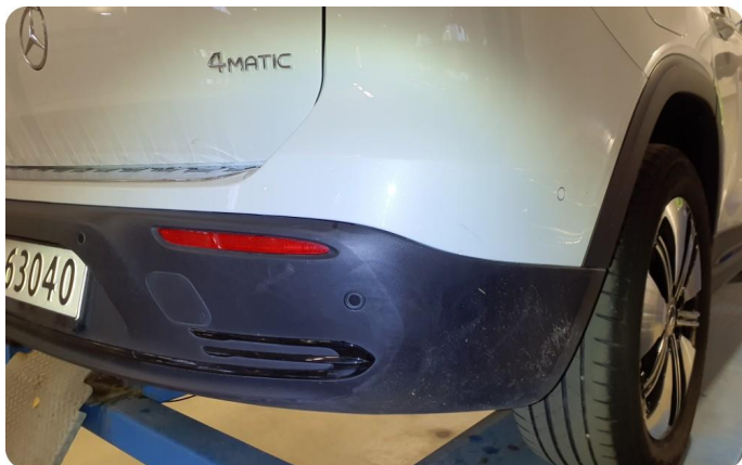
2.5 Skade Små lakk sår og skrubb