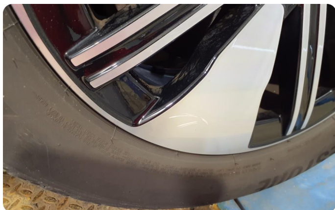
2.3 Kantkjørt felg Diamond Cut To stk vinter felger og to stk sommer felger