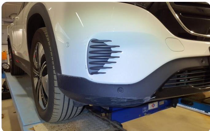
2.4 Skrubbskader underkant