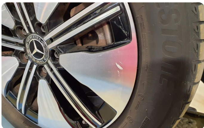
2.3 Kantkjørt felg Diamond Cut To stk vinter felger og to stk sommer felger