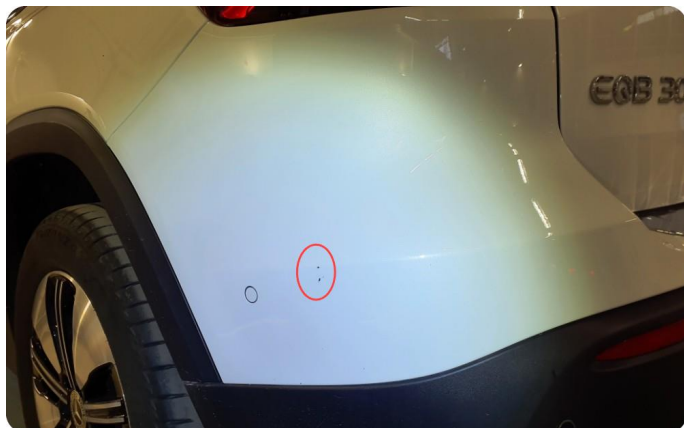
2.5 Skade Små lakk sår og skrubb