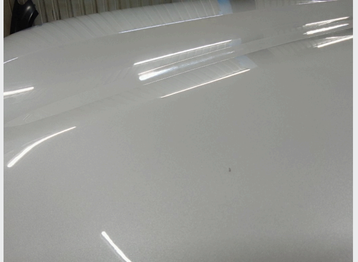
2.3 Steinsprut panser