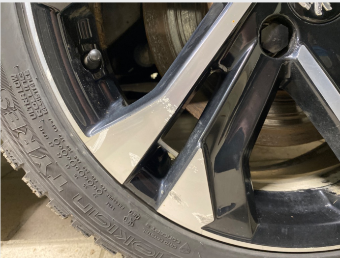
2.18 Mye kantkjørte felger både på sommer og vinter