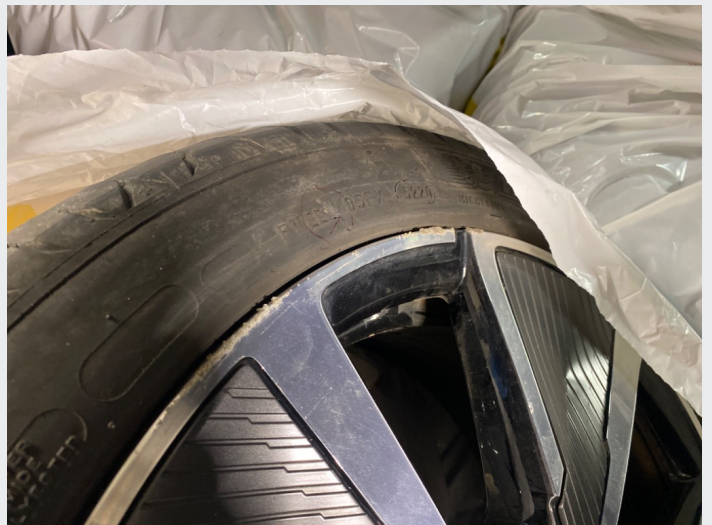
2.18 Mye kantkjørte felger både på sommer og vinter