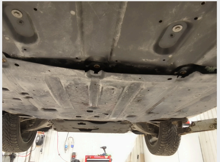
2.2 Beskyttelseplate midt under knekte fester