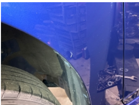
7. Lakk / karosseri utvendig