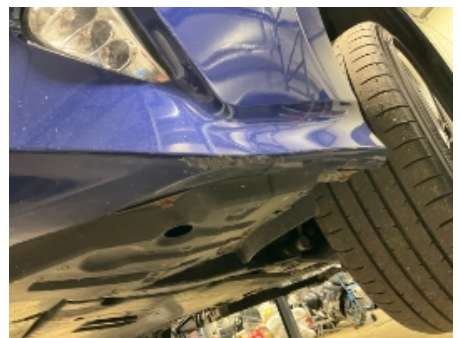
6. Lakk / karosseri utvendig