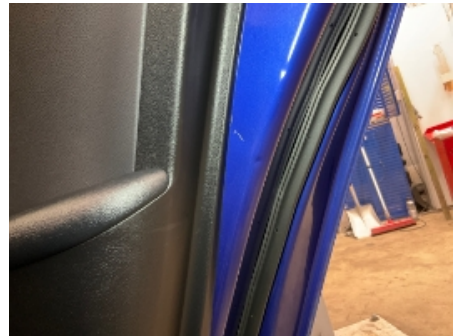
3. Lakk / karosseri utvendig