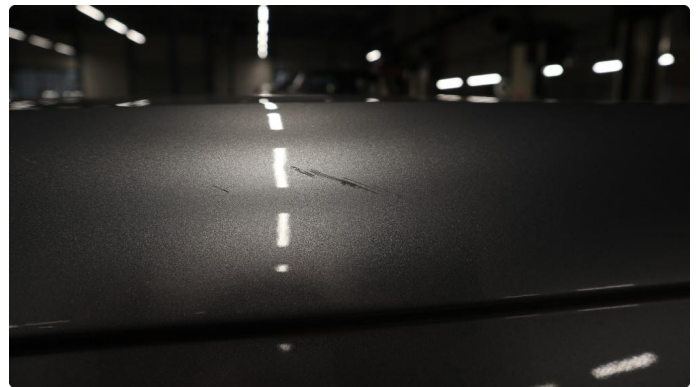
1.1 Generelt mye riper og småbulker