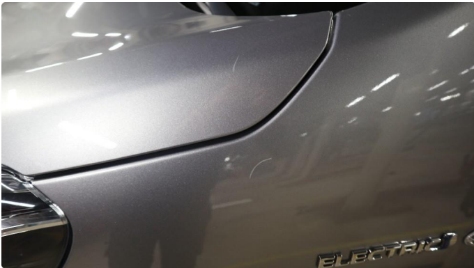
1.1 Generelt mye riper og småbulker