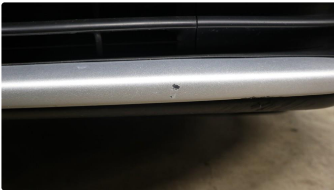
1.1 Generelt mye riper og småbulker