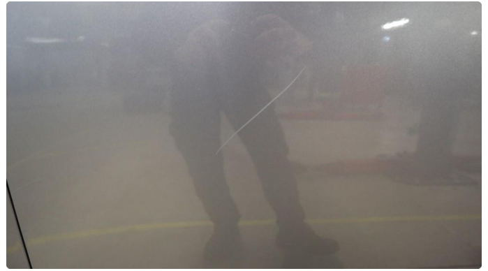
1.1 Generelt mye riper og småbulker