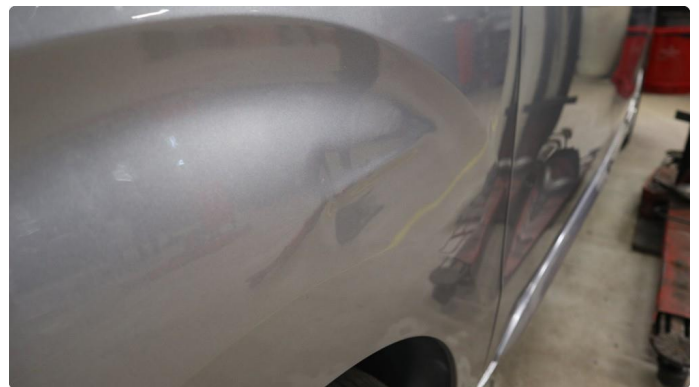
1.1 Generelt mye riper og småbulker