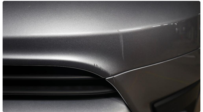
1.1 Generelt mye riper og småbulker