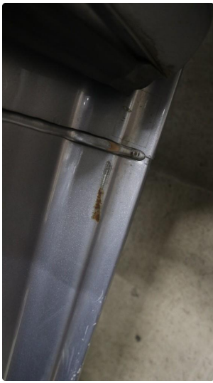
1.1 Generelt mye riper og småbulker