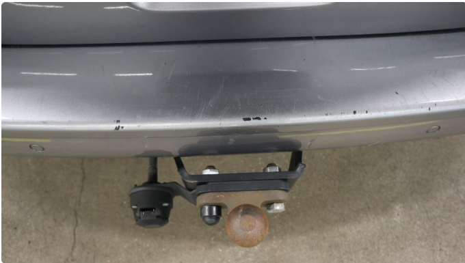
1.1 Generelt mye riper og småbulker