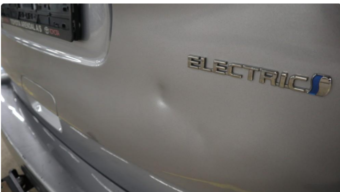
1.1 Generelt mye riper og småbulker