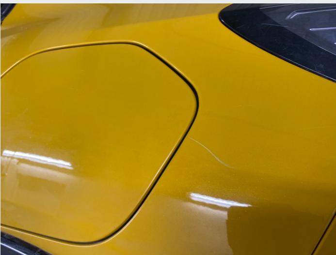
2.7 Stripe venstre bakskjerm ved tanklokk