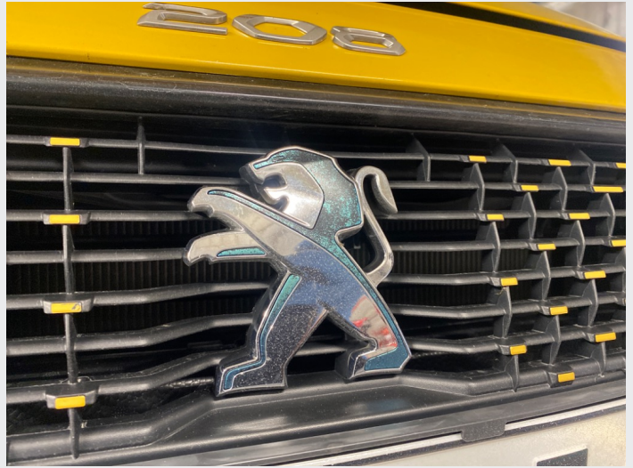
2.8 Flasser på peug merke i front