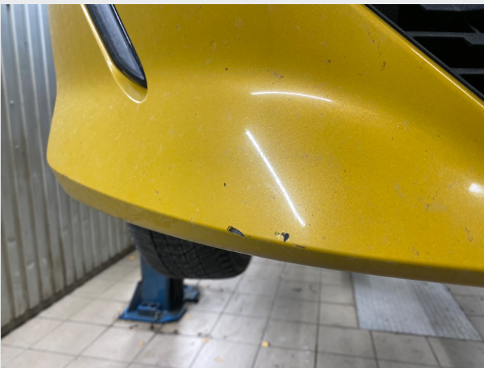
2.8 Noe hakk i fanger høyre foran