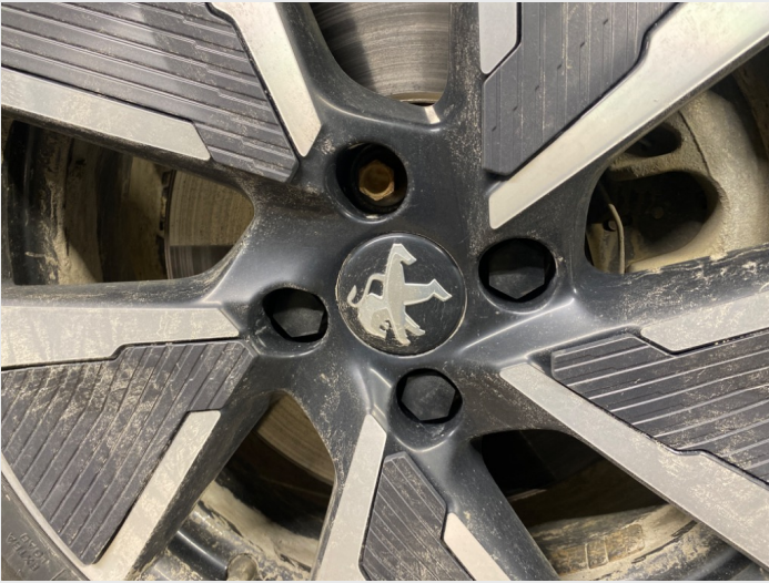
2.18 Mangler ei bolt hette høyre foran