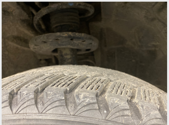
2.17 ubalanse i dekk høyre foran