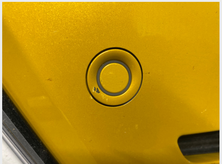
2.8 Noe hakk i fanger høyre foran