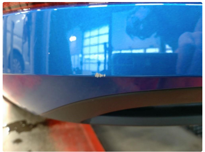
1.5 Ripe(r) ned til grunning