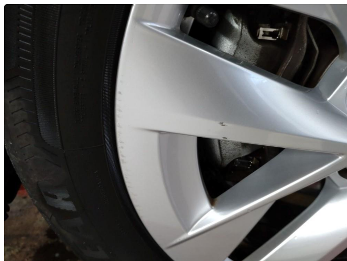
1.2 Ripe (r) gjennom lakk