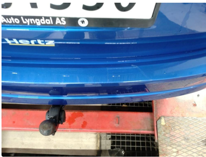
1.5 Ripe(r) ned til grunning