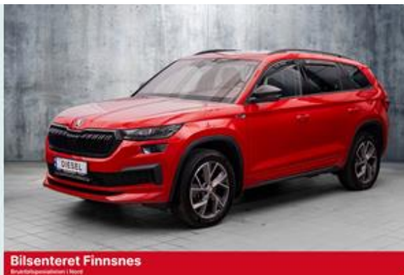
Bilsenteret Finnsnes Brutto/Nettoppsett | Hest

Se mer om forutsetningene for vurderingen og andre vilkår på siste side.