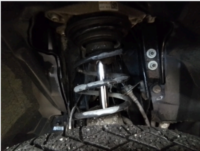
8.6 Skadet støtdempersjett begge sider foran