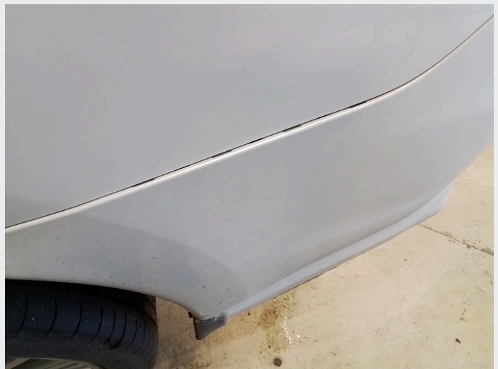
2.8 Skadet støtfangerhjørne bakre venstre