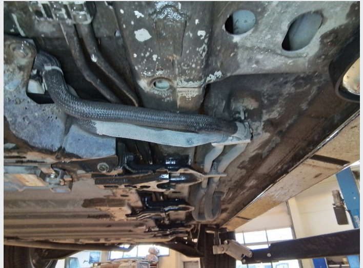
5.8 Knekte fester og klemte kjølerør til fremdriftsbatteri