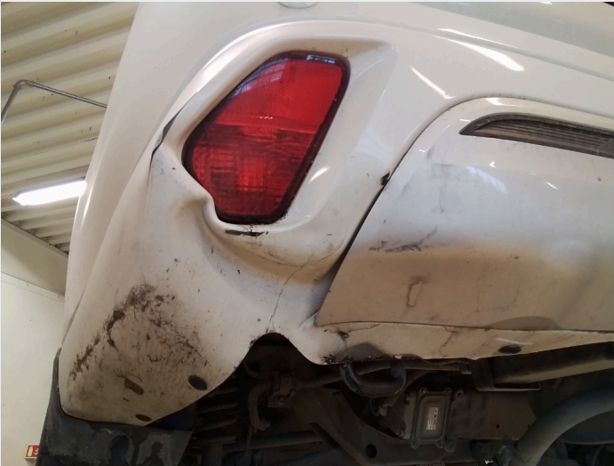
2.8 Skadet støtfangerhjørne bakre venstre