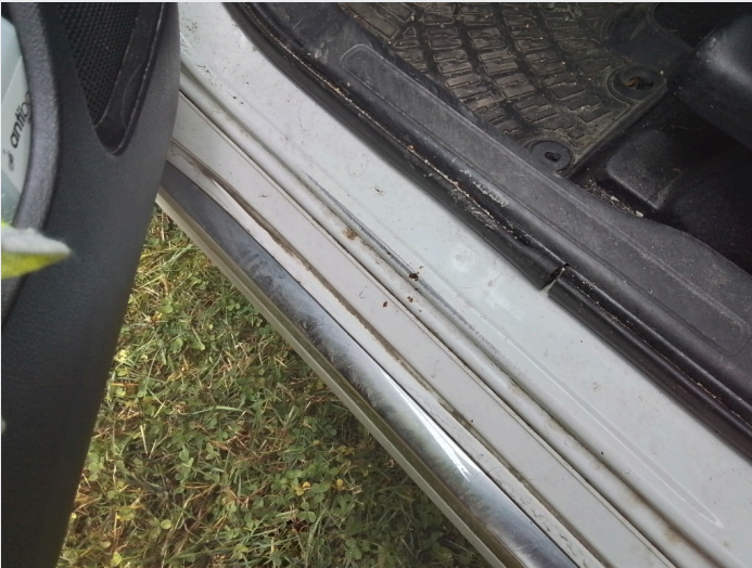
2.5 Slitt lakk innsteg førerdør