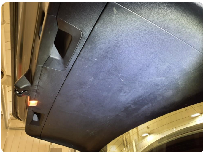
3.2 Bakluketrekke ripe(r)