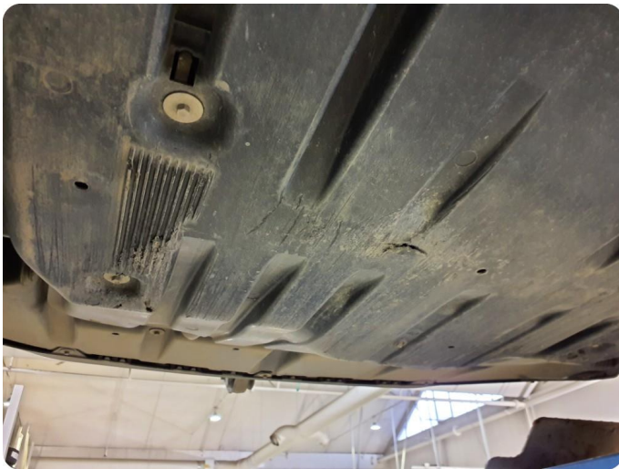
2.1 Beskyttelsesplate skadet/mangler