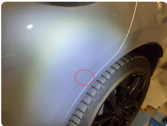
2.4 Bulk med lakkskade