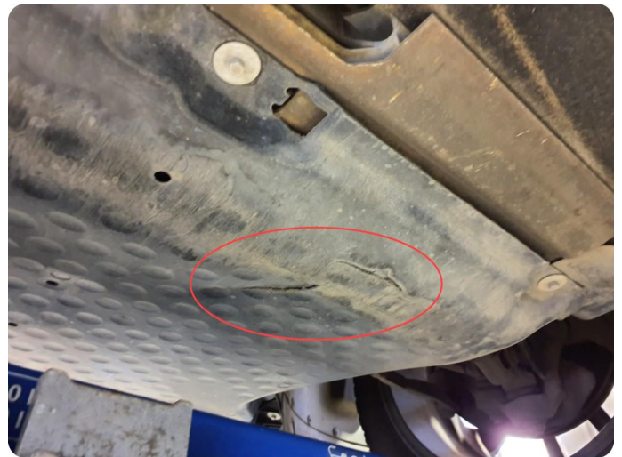
2.1 Beskyttelsesplate skadet/mangler