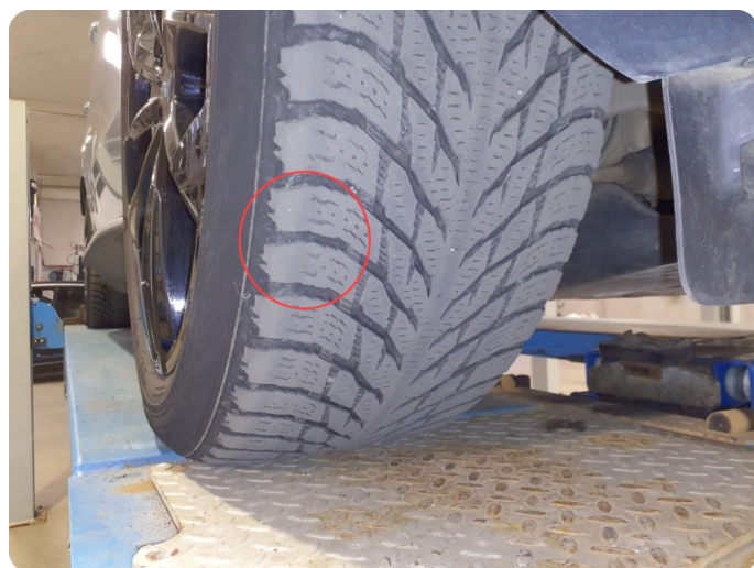
2.7 Skjev slitasje på vinterdekk