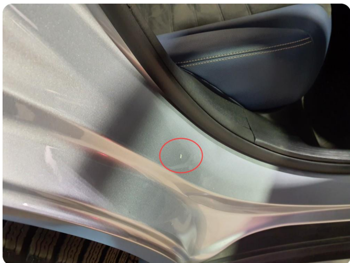
2.8 Bulk(er) med lakkskade