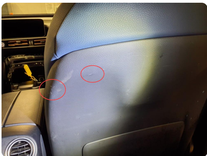
3.1 Skade på seterygg Rifter