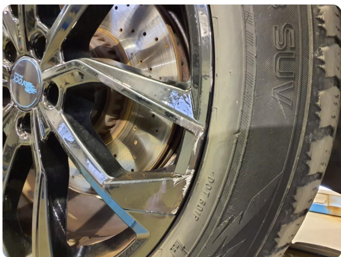
2.6 Kantkjørt felg Fire stk vinterfelg