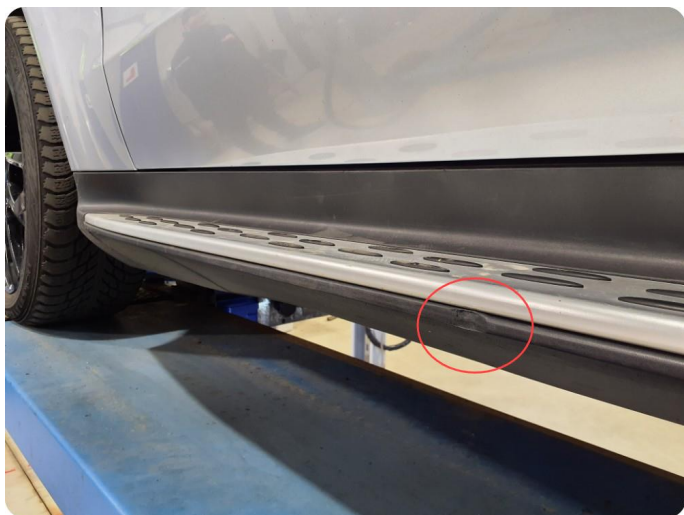
2.12 Øvrige feil Bulket stigtrinn