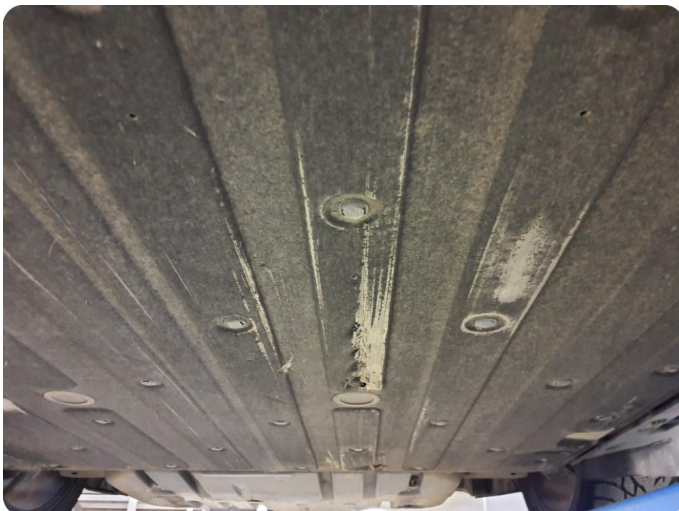
2.1 Beskyttelsesplate skadet/mangler