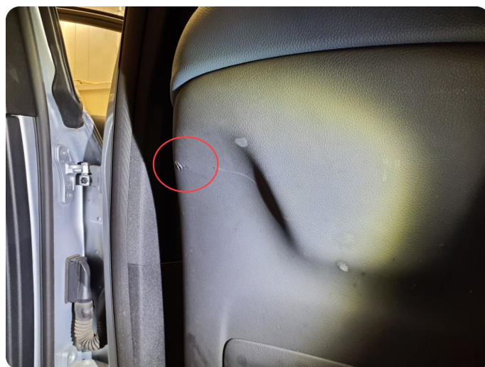
3.1 Skade på seterygg Rifter