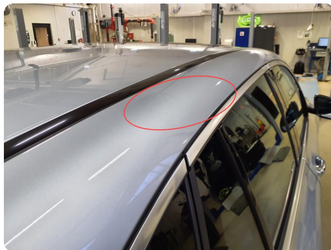
2.13 Bulk Flere bulker