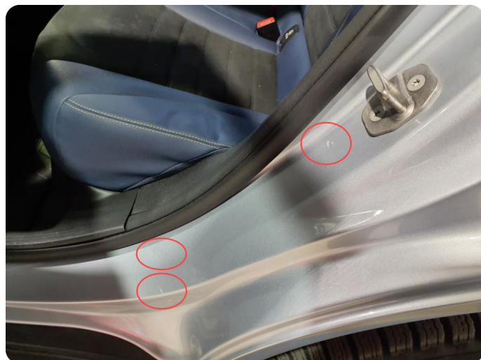
2.8 Bulk(er) med lakkskade