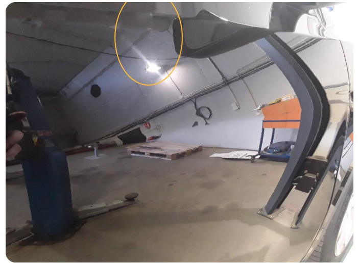
2.2 Bulk med lakkskade