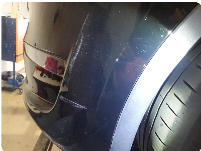
2.8 Ripe(r) ned til grunning