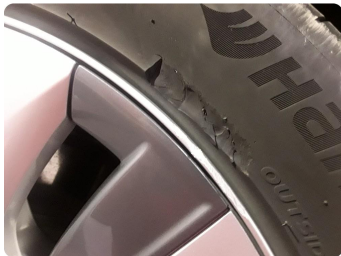
2.7 Dekkskade sommerhjul Ett stk