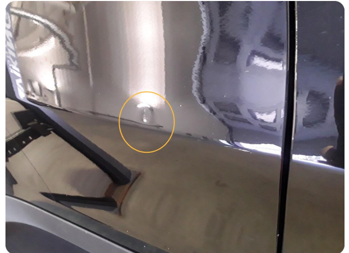
2.4 Bulk med lakkskade