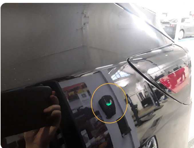
2.5 Bulk med lakkskade