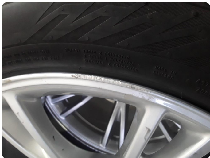
2.6 Kantkjørt felg Fire stk sommerhjul og fire stk vinterhjul