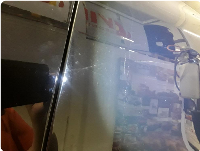
2.3 Ripe ned til grunning