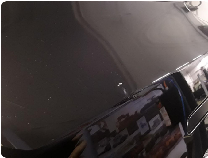
2.1 Ripe ned til grunning