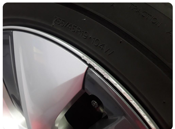
2.6 Kantkjørt felg Fire stk sommerhjul og fire stk vinterhjul