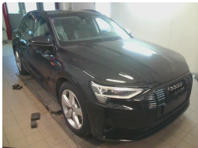
1.1 Øvrig opplysninger