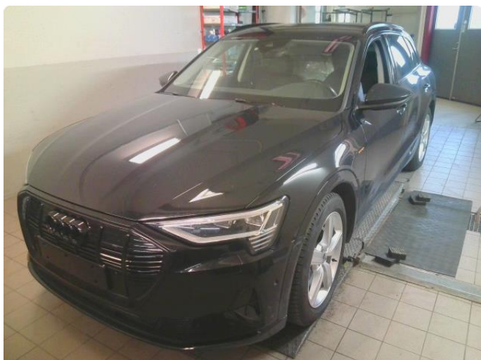
1.1 Øvrig opplysninger