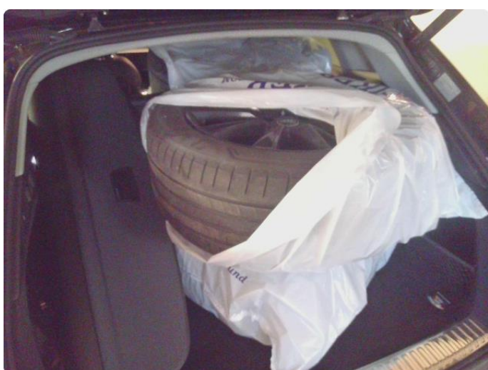
1.1 Øvrig opplysninger