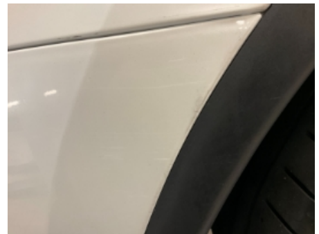
33. Lakk / karosseri utvendig