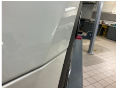
32. Lakk / karosseri utvendig