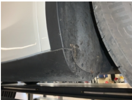
31. Lakk / karosseri utvendig