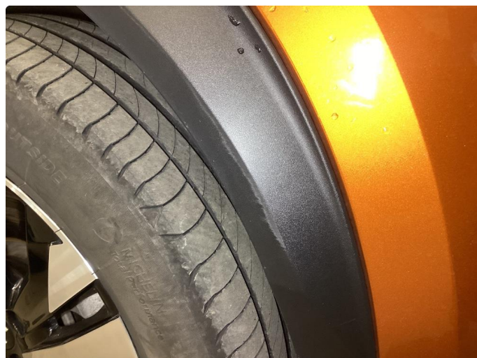
1.2 Skjermutbygger skadet