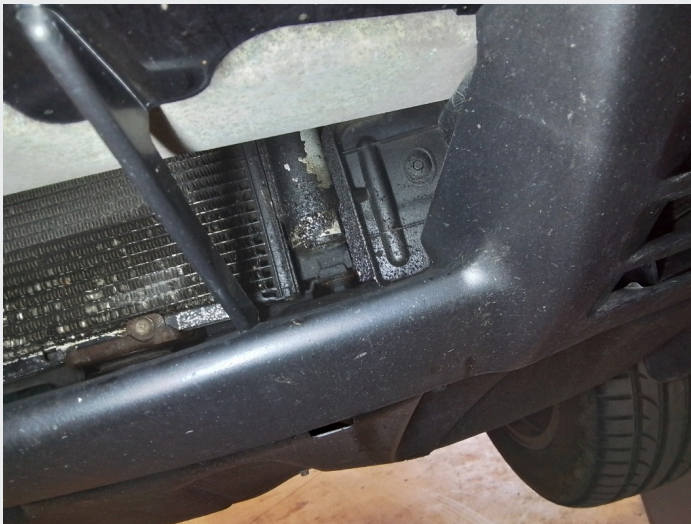
5.8 Lekkasje ac-kondenser