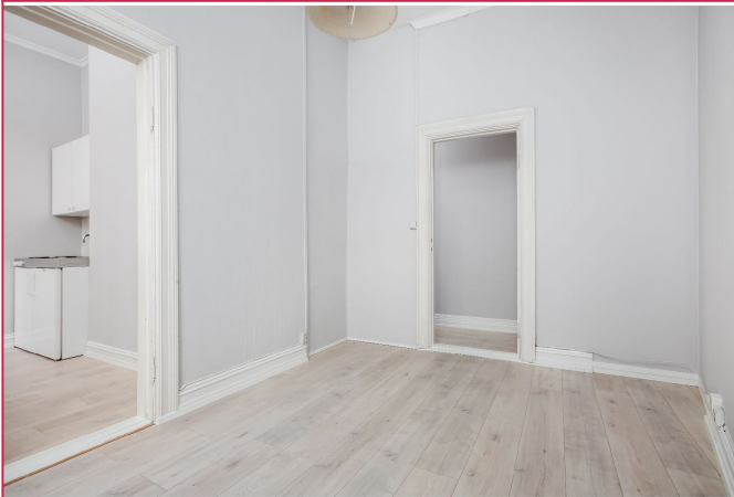
Oppholdsrom vender inn mot rolig bakgård - fra oppholdsrom er det inngang til kjøkken