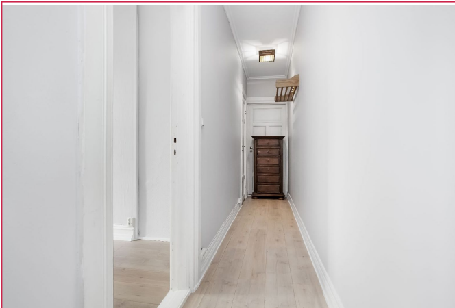
Lang gang med plass til å henge fra seg