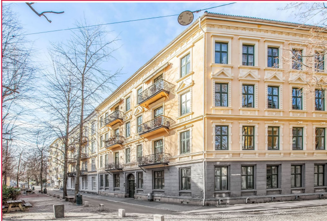
Fasade - Lassons gate er en rolig og bilfri gate