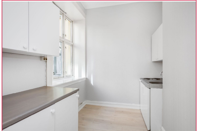
Kjøkken - plass til spisebord