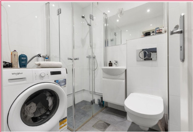
Flislagt bad med varmekabler.