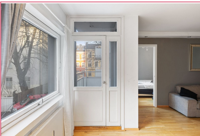
Utgang til balkong.