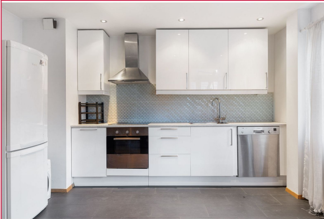
Delikat kjøkken med hvitevarer.