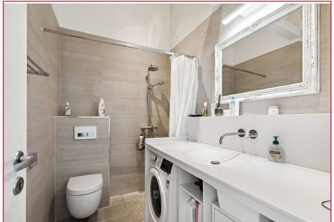
Flislagt bad med vegghengt wc, servant, dusjhjørne og vaskemaskin