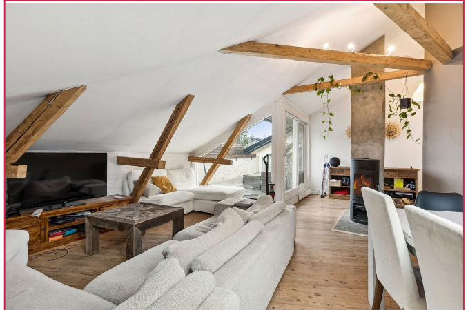
Romslig stue med peis og utgang til skjermet balkong