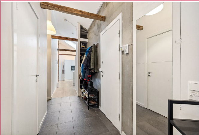
Entre med plass til sko og yttertøy. Varme i gulv