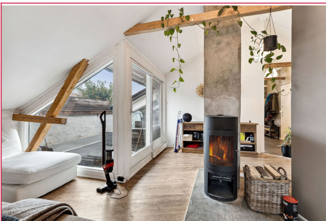
Stue med peis