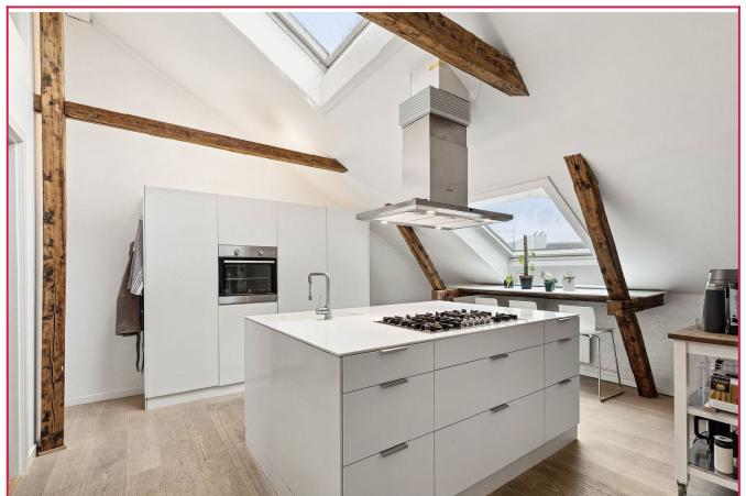
Lyst kjøkken med kjøkkenøy og hvitevarer