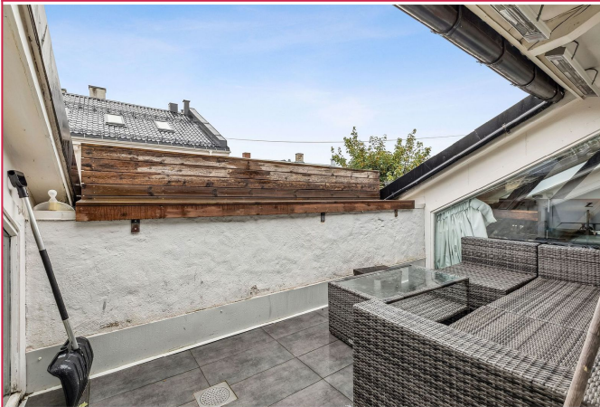
Skjermet balkong på ca 10 kvm