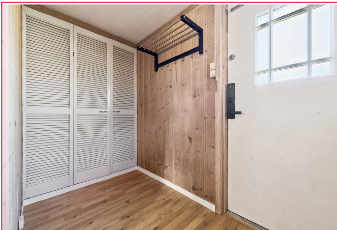
Velkommen inn! Entre med innebygd garderobeskap