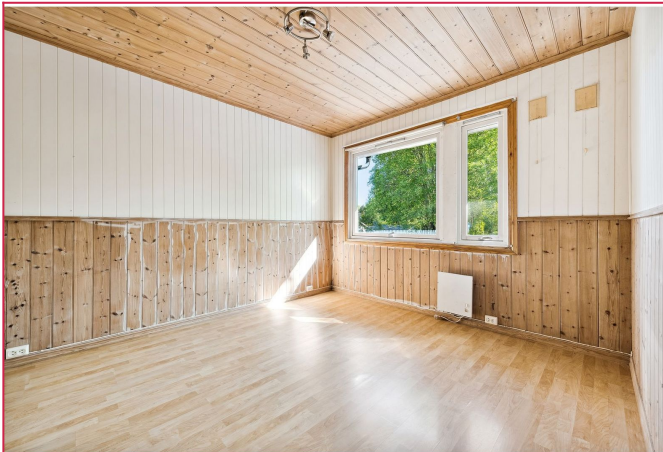
Soverom 2 - Skyvedørsgarderobe medfølger