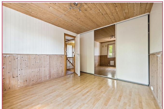
Hovedsoverommet fremstår som lyst og romslig. Skyvedørsgarderobe medfølger