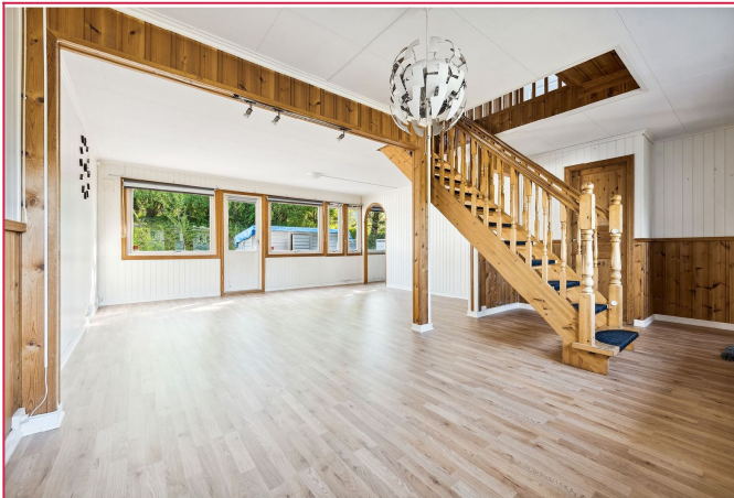
Lys og innbydende stue med gode møbleringsmuligheter