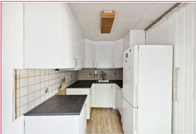
Praktisk kjøkken med hvitevarer