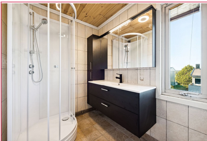
Pent flislagt bad med varmekabler