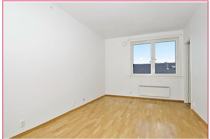
God plass til det man trenger i stuen