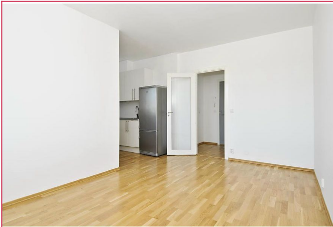
Lys og pen stue