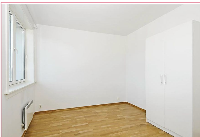
Soverommet har plass til både dobbeltseng og garderobe