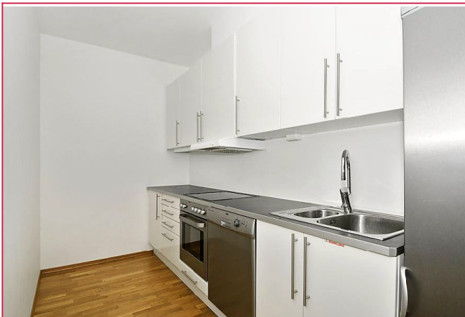
Lyst og pent kjøkken med medfølgende hvitevarer