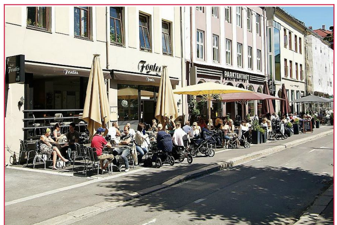
Grünerløkka byr på alt av fasiliteter