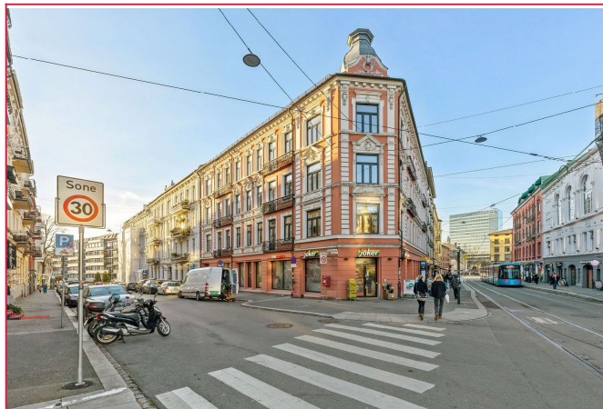
Fasade - velkommen til Bogstadveien 62 C, ypperlig og sentral beliggenhet.