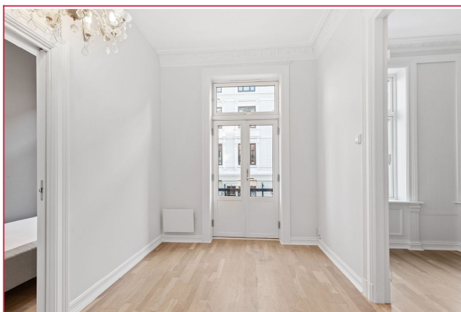
Kjøkken - god mulighet for spiseplass, samt dør til fransk luftbalkong.