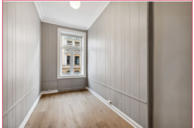
Soverom 2 - Romslig soverom med gode innredningsmuligheter.