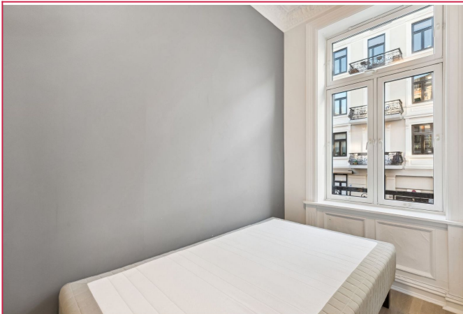
Soverom 3 - God plass til seng og mulighet for oppbevaring i andre enden av rommet.