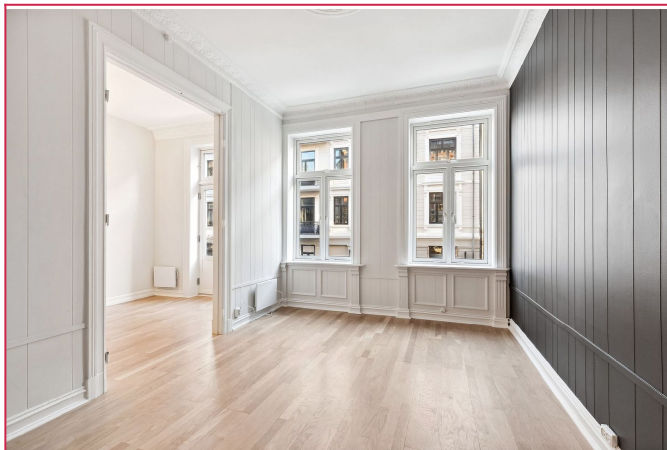
Stue - flott stue med store vinduer og god takhøyde. Praktisk åpning mot kjøkken.