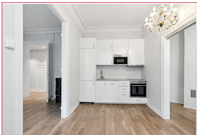
Kjøkken - nyere kjøkken med integrert kjøll/frys, oppvaskmaskin, micro og komfyr/platetopp.