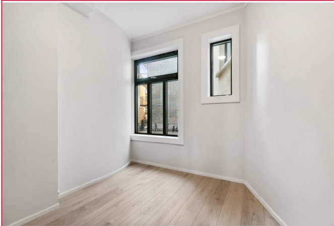
Soverom - hovedsoverom som vender mot bakgård.