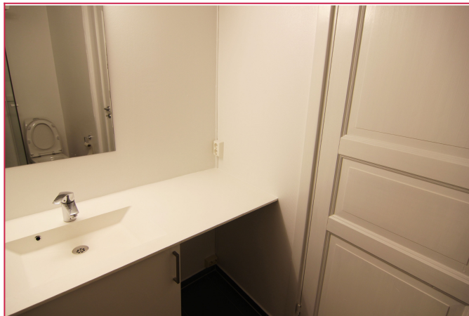
Bad med varme i gulv og opplegg for vaskemaskin.