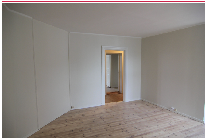
Stor stue med store vindusflater.