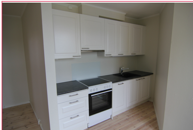
Åpen stue/kjøkken løsning, hvitevarer medfølger.