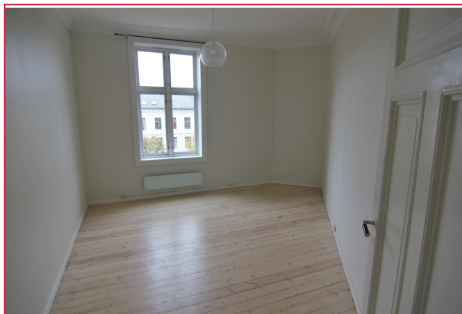
Leiligheten har 3 romslige soverom. Soverom 1.