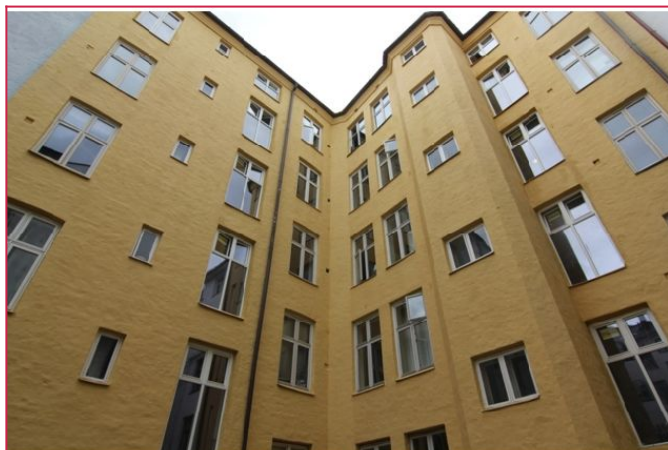
Fasade sett fra bakgård.