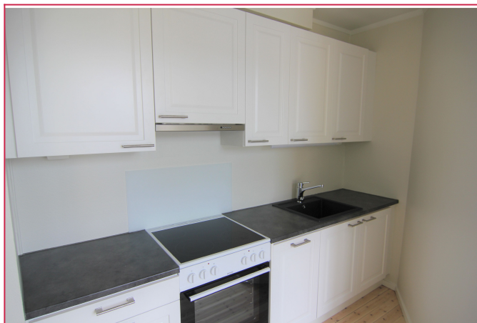
Kjøkkenet holder en god standard.