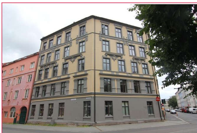
Fasade sett fra gate.