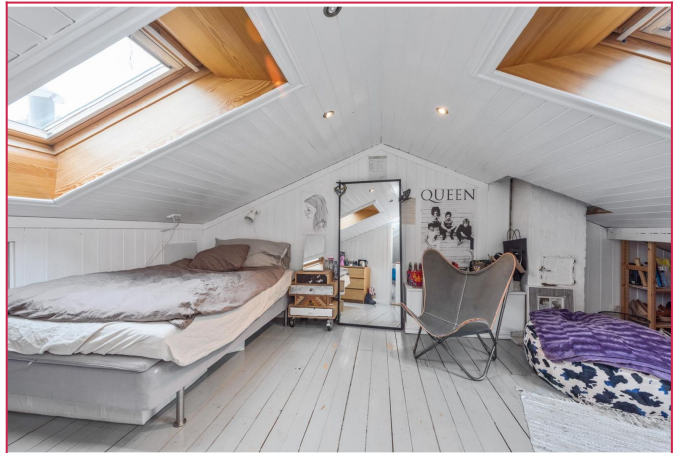
Soverom på loft (3. etg)