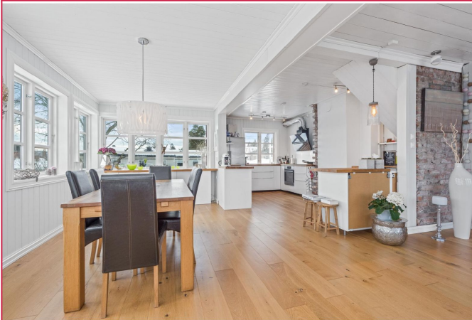
Stue og kjøkken