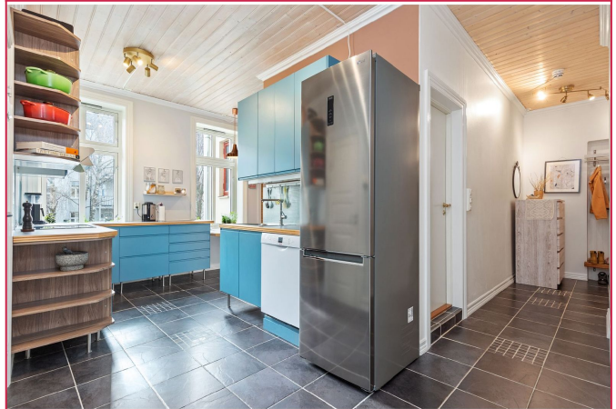
Flott og stort kjøkken. Det er varmekabler i gulv. Leiligheten har smartsystem