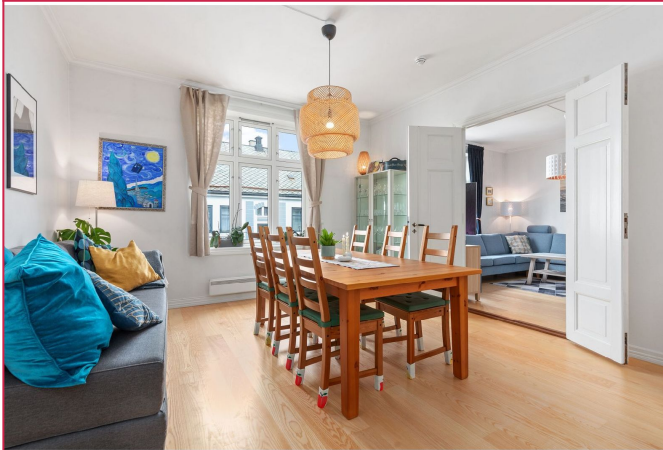
Leiligheten har 2 stuer og er møblert. Det er også vedfyring i leiligheten