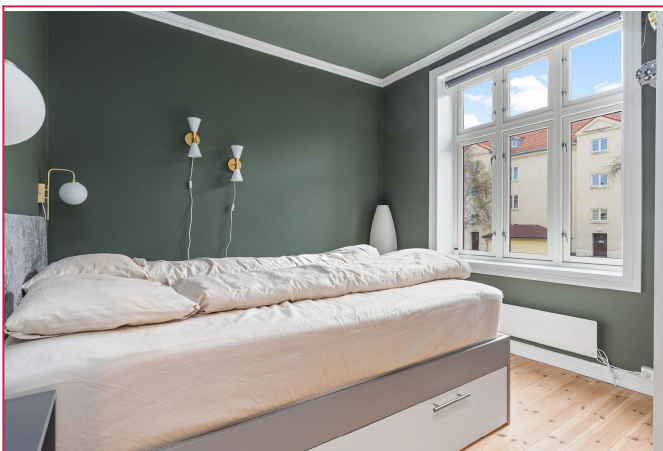
Soverom. Her kan man bruke smartsystemet på ovn, rullegardin og lys