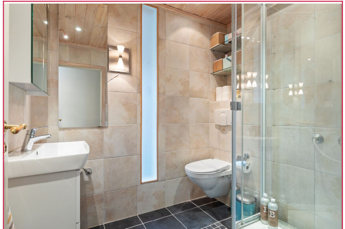
Flislagt bad med varmekabler i gulv