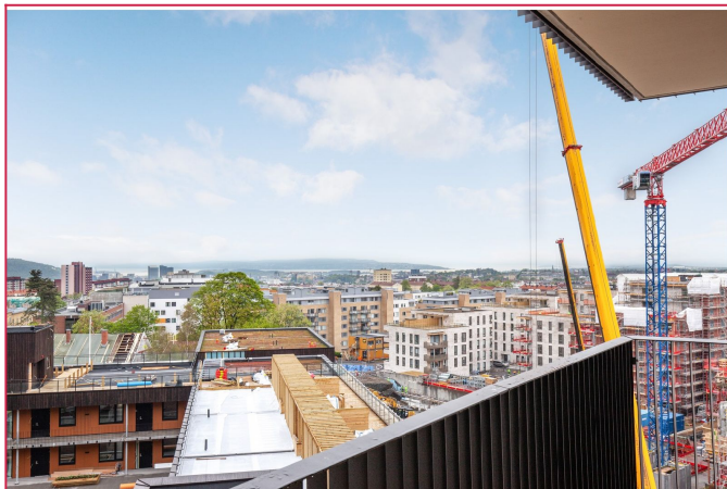
Utsikt fra balkongen