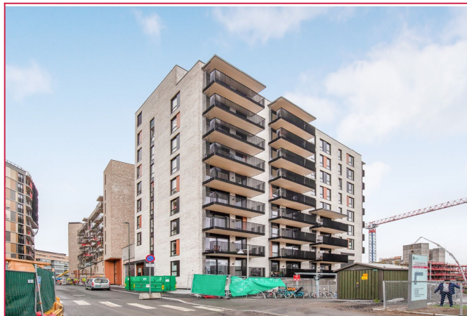
Velkommen til Sandakerveien 110