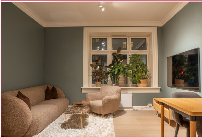
Boligen leies ut delvis møblert, med møblene av høy kvalitet.