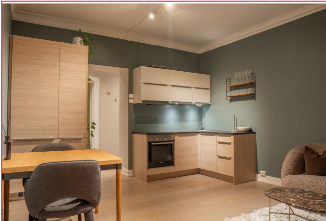
Elegant HTH-kjøkkenet med integrerte hvitevarer.