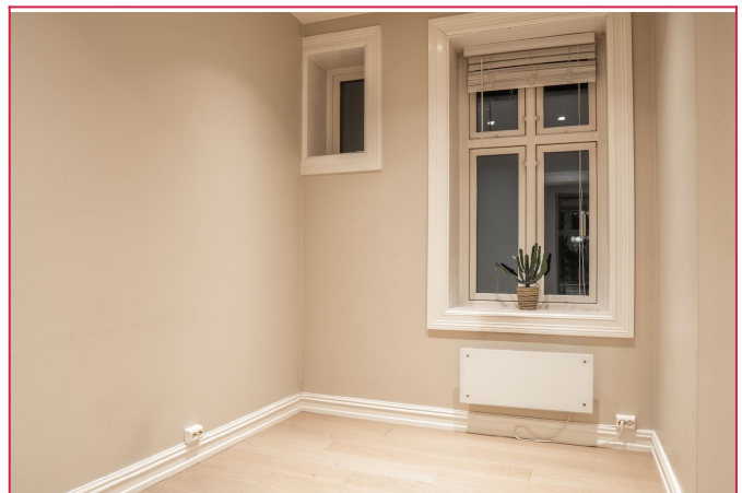
Soverom 2 som kan brukes som barnerom, gjesterom eller kontor, med plass til seng og skap.