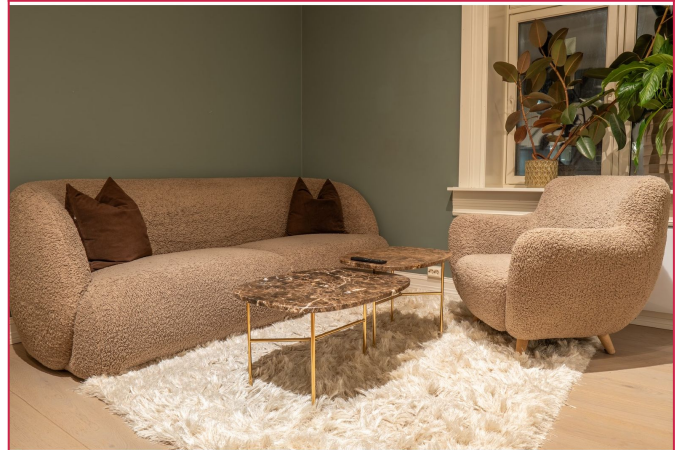
Sofa, lenestol, salongbord og spisebord med stoler medfølger. Boligen er ledig omgående.