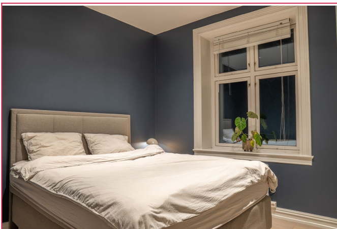
Romslig hovedsoverom med stor seng og garderobeskap med skyvedører som medfølger.