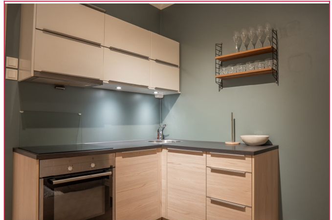
Nærbilde av kjøkkenet med moderne detaljer og praktiske løsninger.